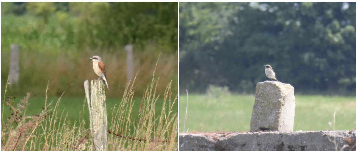
Abb. 2: Neuntöter-Männchen (links) und Braunkehlchen-Männchen auf Warten. – Male Red-backed Shrike (left side) and male Whinchat on perches (Photos: © O. OLEJNIK).

Eigenen Kartierungen und Beobachtungen zufolge kam es insbesondere bei Grau- ( Emberiza calandra ) und Goldammern ( Emberiza citrinella ), Grünfinken ( Carduelis chloris ) und Feldsperlingen ( Passer montanus ) nach Ansiedlung von Neuntöttern nicht zu einer Vertreibung aus dem gemeinsam genutzten Umfeld. Oft wurden diese Vögel auch während der territorialen Phase des Würgers in nächster Nähe beim Neuntö-