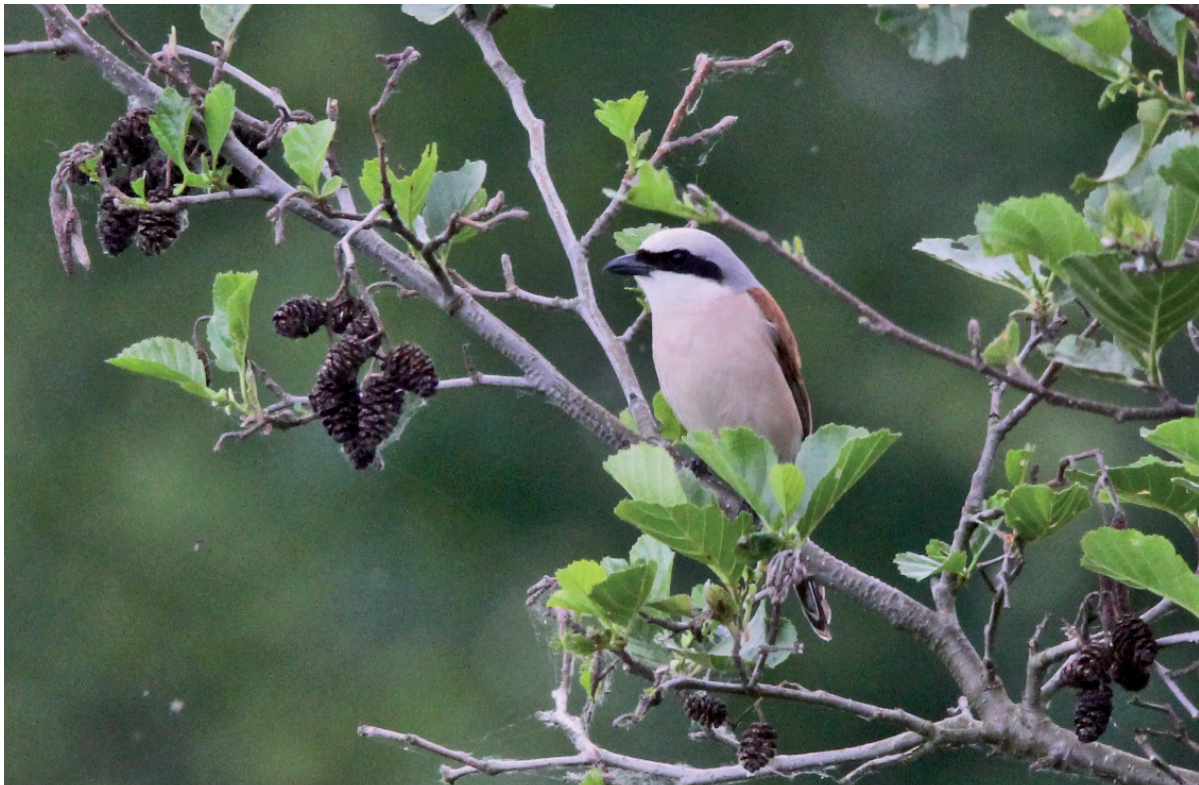
Abb. 3: Neuntöter-Männchen. – Male Red-backed Shrike.

gel in seinem Revier wird in der Literatur unterschiedlich beschrieben und vor allem in der zweiten Hälfte des 19. Jahrhunderts negativ ausgelegt (z.B. BREHM 1882). Laut DURANGO (1956) werden Kleinvögel erst nach der Paarbildung der Würger aus deren Territorium verjagt. NEUSCHULZ (1988) beobachtete Angriffe vor allem von Neuntöter-Männchen während der Phase der Paarbildung, der Bebrütungszeit und auch, aber schwächer, in der Nestlingsperiode der Würger. Besonders aggressiv zeigen sich die Neuntöter nach PANOW (1996) ebenfalls zur Zeit der Revierbesetzung, des Nestbaus und der Eiablage. Schon zu Anfang des 20. Jahrhunderts lagen aber relativierende Aussagen hierzu vor (SOFFEL 1922, NIETHAMMER 1937, MÜNSTER 1958).