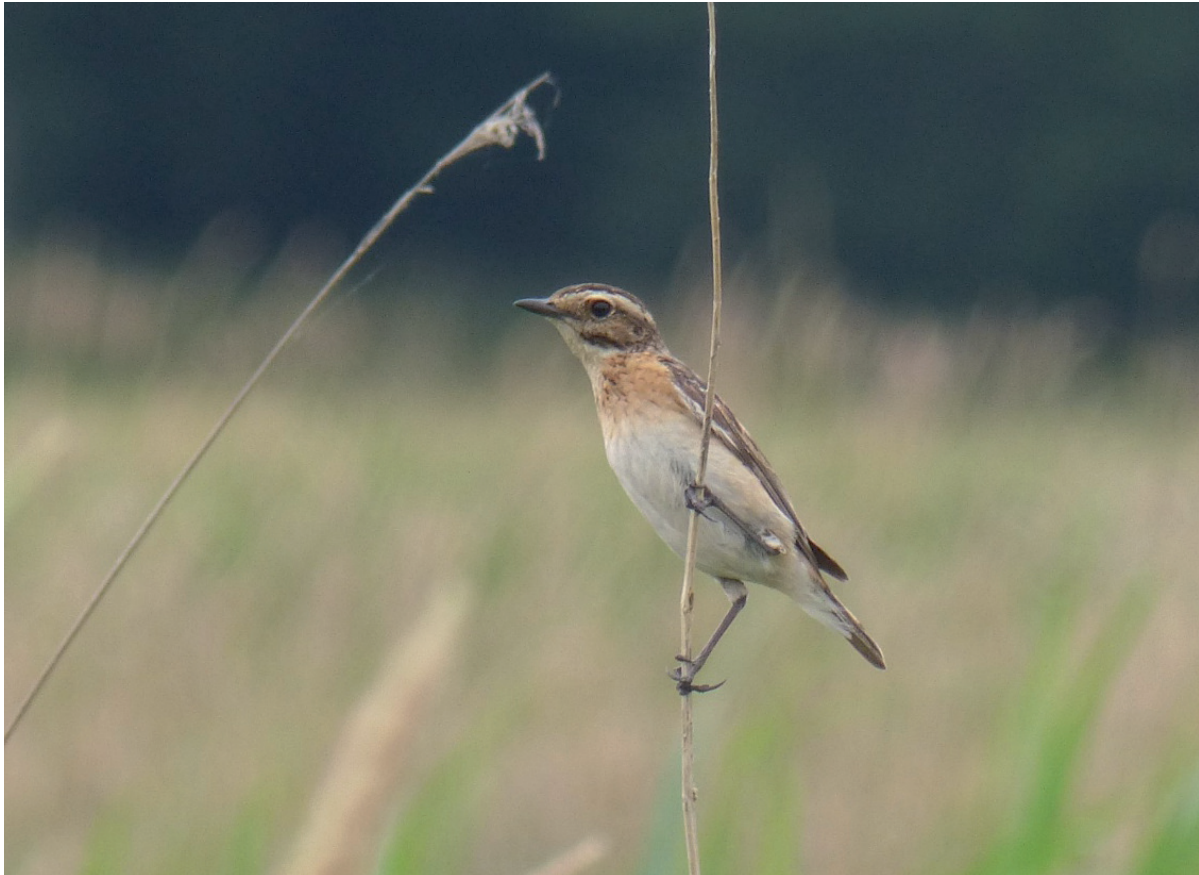
Abb. 5: Braunkehlchen-Weibchen auf einer Warte. – Female Whinchat on a perch.