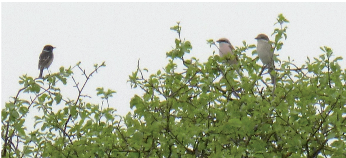
Abb. 4: Schwarzkehlchen-Männchen und Neuntöter-Paar auf Warten. – Male Stonechat and a pair of Red-backed Shrike on perches.