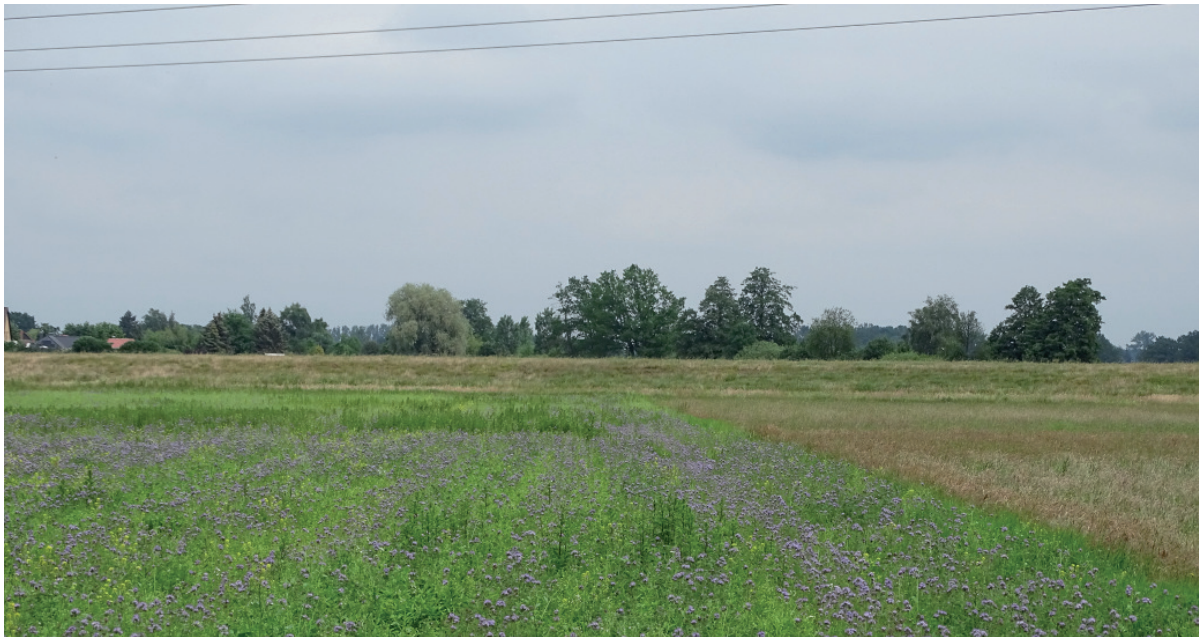
Abb. 2: Brutplatz des Braunkehlchens auf einjähriger Blühfläche südöstlich von Dannenberg (Elbe) am 11.6.2019. - Approximate nest site of Whinchat in a first-year flower patch SE of Dannenberg on 11.6.2019.