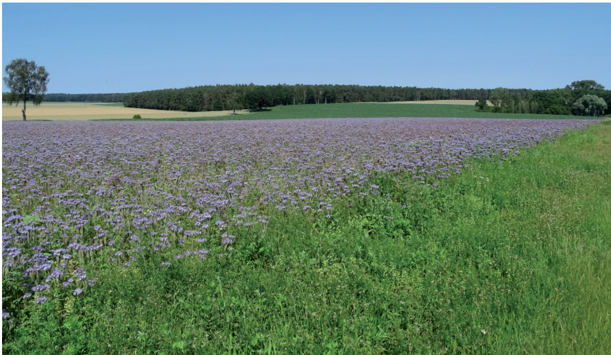
Abb. 4: Unbesiedelte, einjährige Blühfläche südöstlich von Gamehlen am 23.6.2019. - First-year, unoccupied flower patch SE of Gamehlen on 23.6.2019.

Dichten könnte somit eine höhere Antreffwahrscheinlichkeit in den grünlandnahen Blühflächen bedingen. Ob Blühflächen innerhalb eines Grünlandkomplexes besonders attraktiv auf rastende Braunkehlchen wirken, wurde nicht untersucht.