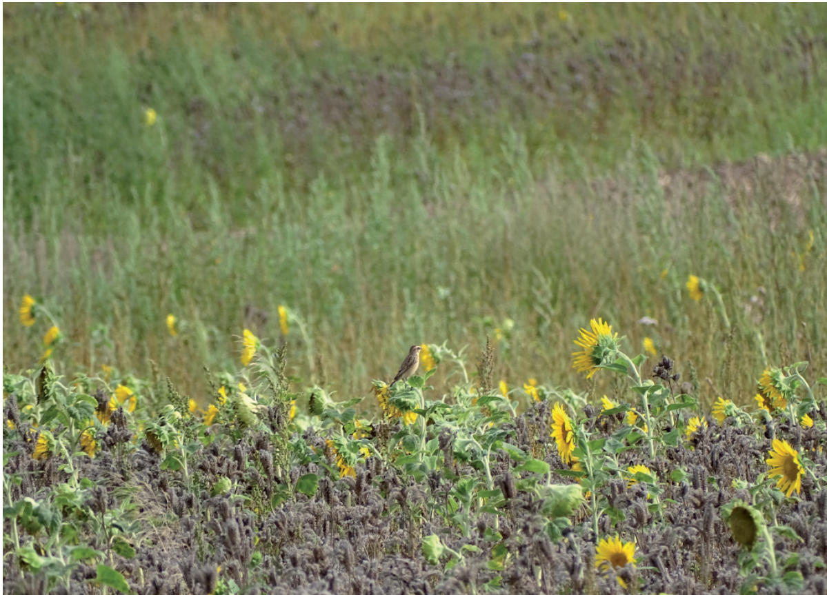
Abb. 5: Rastendes Braunkehlchen auf einjähriger Blühfläche südwestlich von Lüsen am 7.8.2019. - Passage Whinchat on first-year flower patch SW of Lüsen on 7.8.2019.