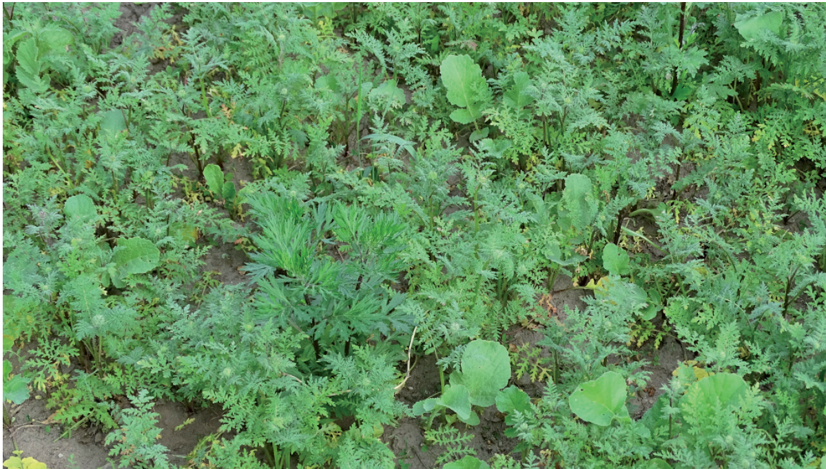
Abb. 3: Unbesiedelte einjährige Blühfläche südlich von Beutow am 28.5.2019. - First-year, unoccupied flower patch south of Beutow on 28.5.2019.