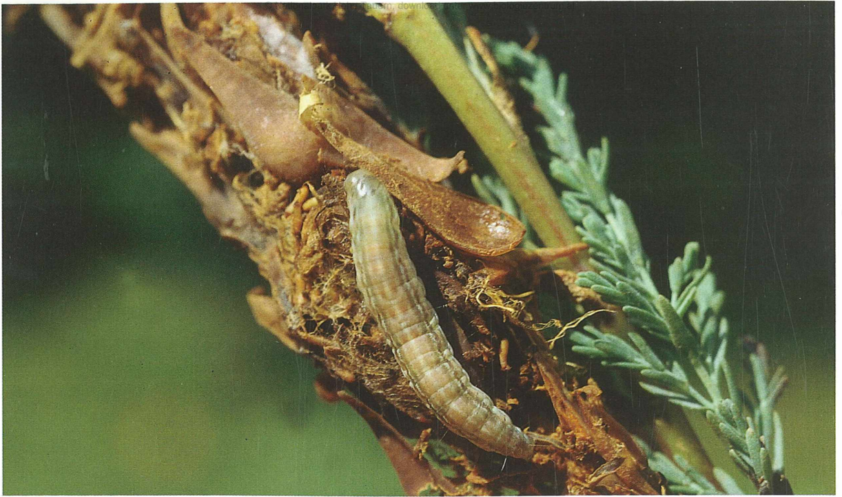
Abb. 3: Raupe von Merulempista cingillella