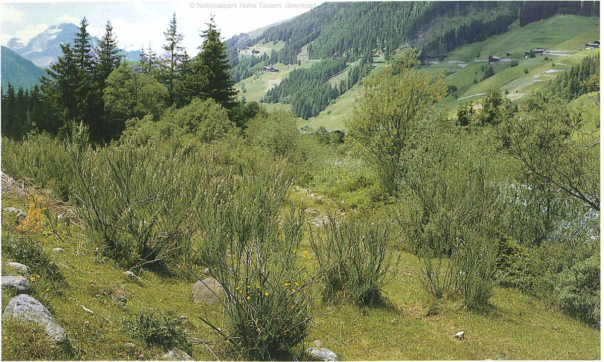
Abb. 1: Biotop von Merulempista cingillella (Salici-Myricarietum) (St. Jakob in Deferegggen)