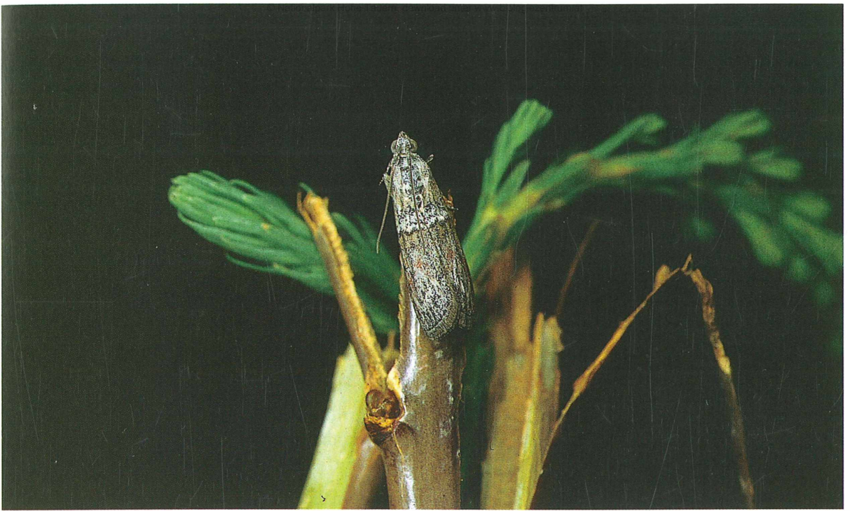
Abb. 5: Merulempista cingillella in natürlicher Ruhestellung