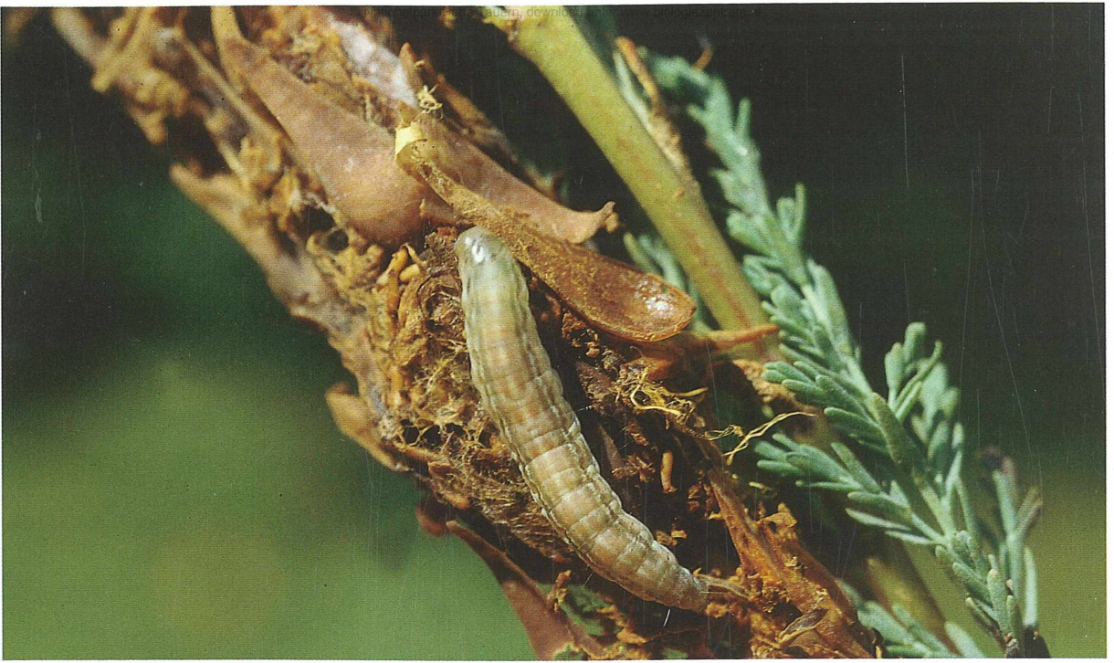
Abb. 3: Raupe von Merulempista cingillella