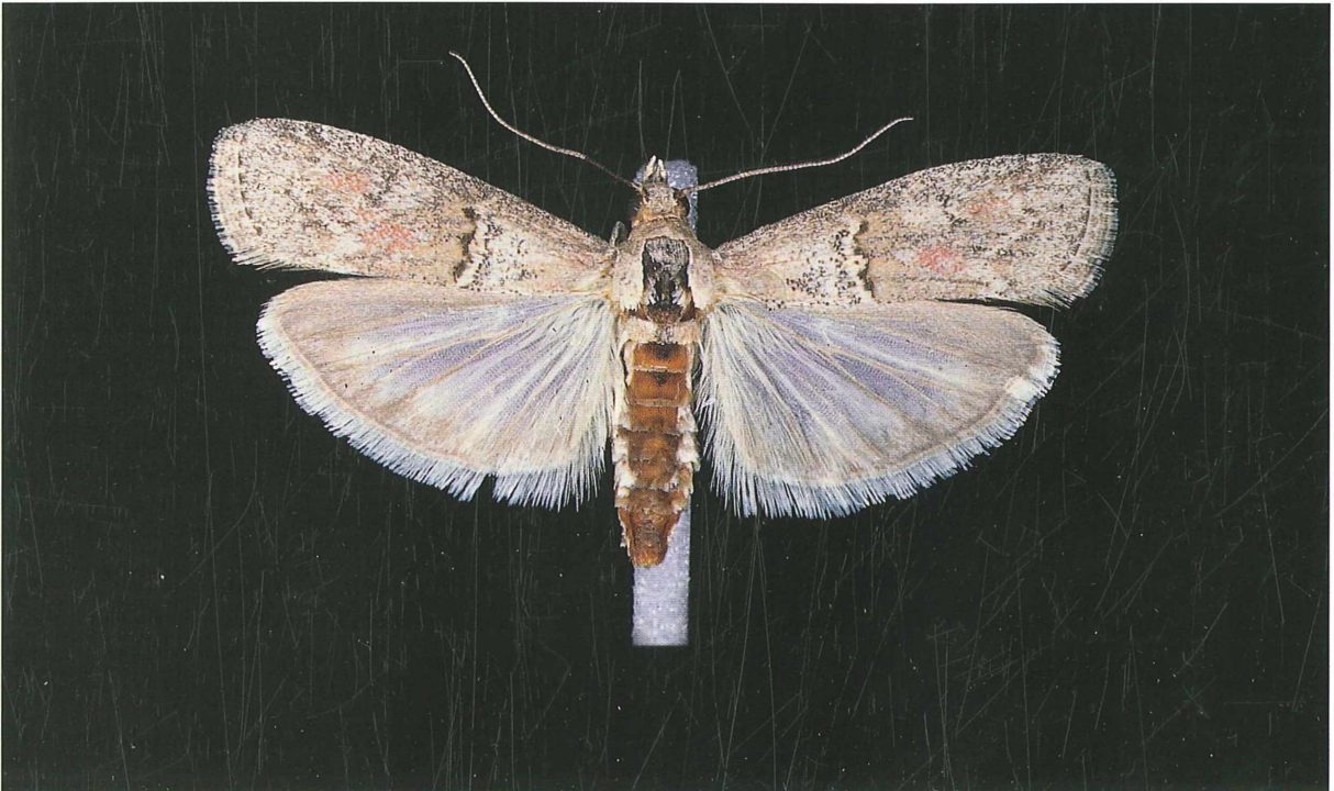
Abb. 6: Merulempista cingillella , präparierter Falter