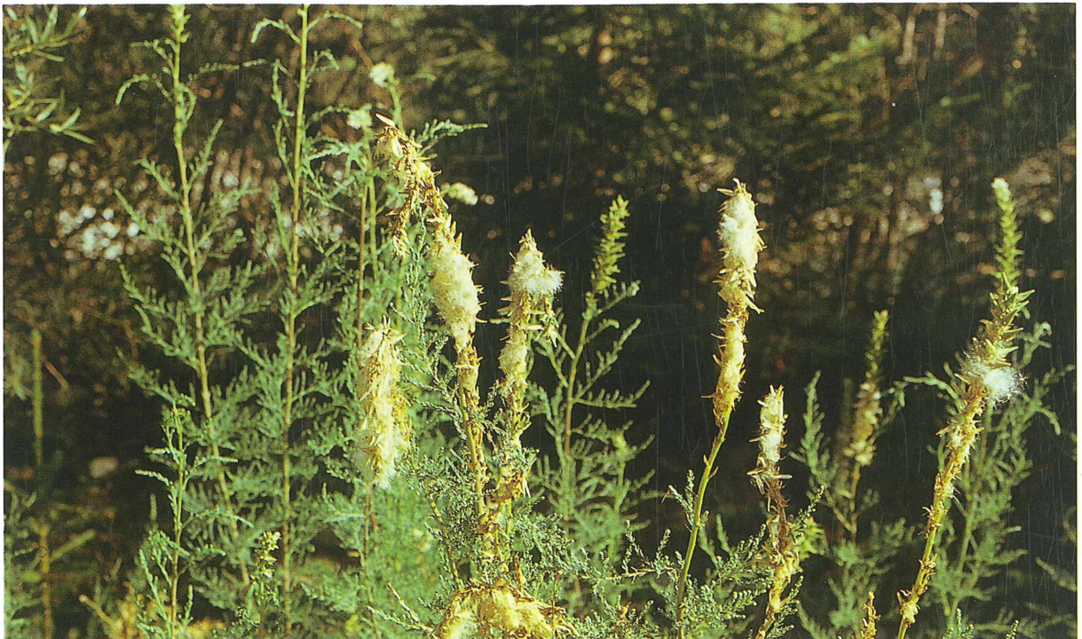
Abb. 2: Durch Raupengespinnst versponnene Samenwolle von Myricaria germanica