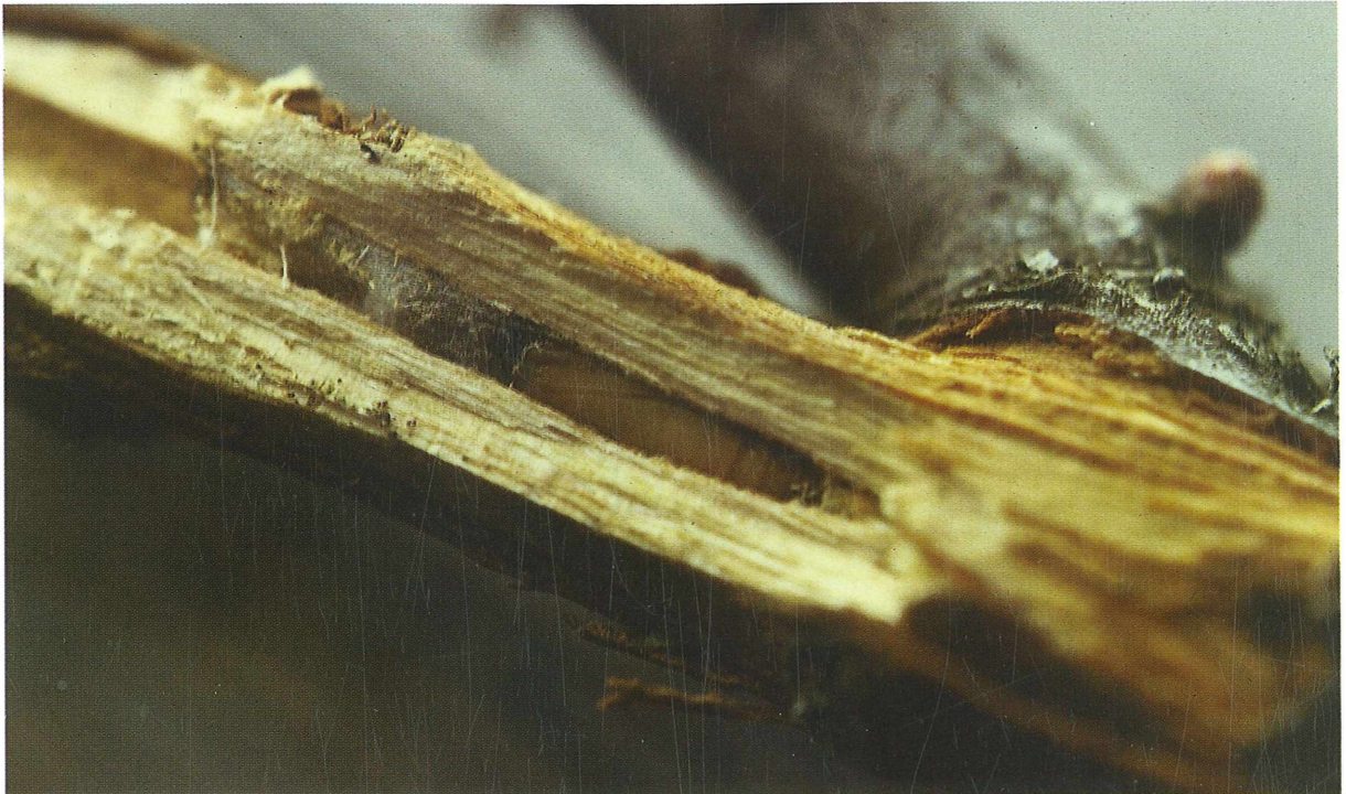
Abb. 4: Puppe von Merulempista cingillella in Myricaria -Ästchen