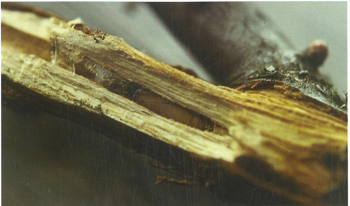
Abb. 4: Puppe von Merulempista cingillella in Myricaria -Ästchen