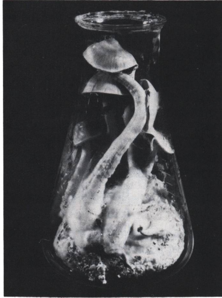
Abb. 1: Kultur der Psilocybe cubensis auf Pferdedung/Reis-Gemisch