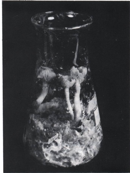
Abb. 3: Fruktifikation des Gymnopilus purpuratus auf feuchten Reiskörnern