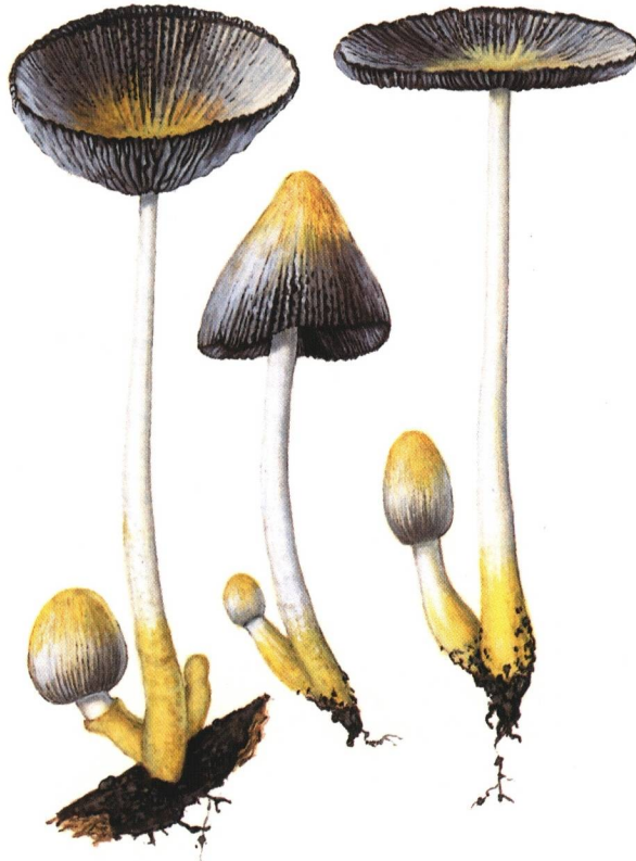
Farbtafel 2: Coprinus citrinovelatus (Aquarell: E. Ludwig)

bis breithalsig-flaschenförmig, blaßgelb; 40 - 110 x 15 - 35 \mu m. Pleurozystiden vorhanden; ähnlich geformt. HDS zellig, aus bis zu 30 \mu m breiten Elementen. Velum überwiegend aus zylindrischen, bisweilen etwas unregelmäßigen Elementen; keine Kugelzellen. Schnallen vorhanden.