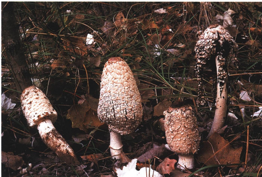
Farbtafel 1: Coprinus levisticolens