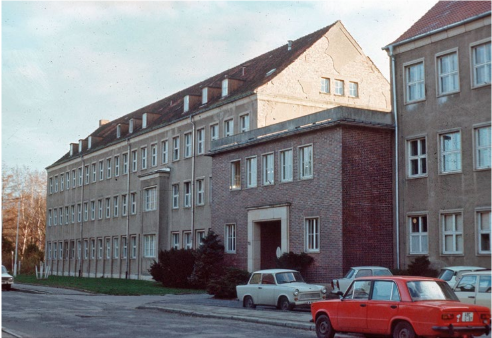
Abb. 3: Lehrstuhl für Mikrobiologie in der Jahn-Str. 15 in Greifswald im November 1989. Die drei Westfenster im Dachstuhl gehörten zum Bürozimmer von Prof. Kreisel