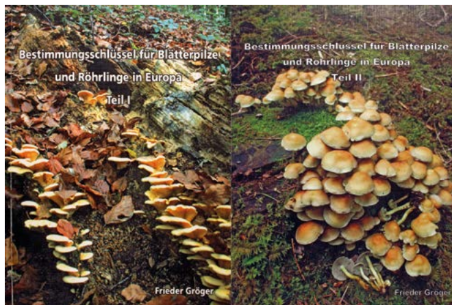
Abb. 9 (links): Buchdeckel der „Bestimmungsschlüssel für Blätterpilze und Röhrlinge in Europa“ von F. Gröger (2006, 2014).