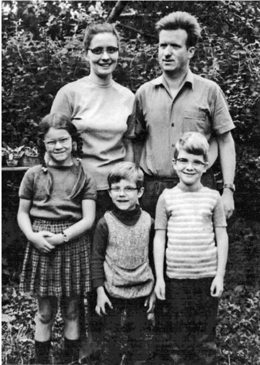
Abb. 2: Familie Gröger in Warza im Jahr 1973.

war in verschiedenen Kirchgemeinden als Organist bei den Gottesdiensten tätig und förderte auch seine Kinder auf musikalischem Gebiet; einer seiner Söhne studierte später Oboe und wurde Berufsmusiker. Frieders Frau war eng an die Kirchgemeinde gebunden und unterstützte das Gemeindeleben unter anderem durch Kinderstunden.