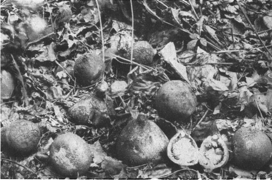
Abb. 1: Riesen-Erdstern oder Schwarzköpfiger Haarstern ( Trichaster melanocephalus ) bei Greifenstein a. d. Donau.

Die innerste Schicht der Exoperidie, die der Endoperidie anliegt, wird von der Pseudoparenchym-schicht gebildet. Sie ist 5–6 mm dick, weiß, stellenweise leicht rötlich und zerbricht häufig in Schollen. Sie besteht aus dünnwandigen, hyalinen Hyphen von verschiedener Form und Größe, die sich aus großen dünnwandigen Zellen, meist von 12 \mu Durchmesser, zusammensetzen. Durch Quellung der Zellen infolge Wasseraufnahme und dadurch bedingtes stärkeres Anschwellen auf das Doppelte sowie durch ein plötzlich auftretendes starkes Flächenwachstum verursacht diese Schicht die Sprengung und das