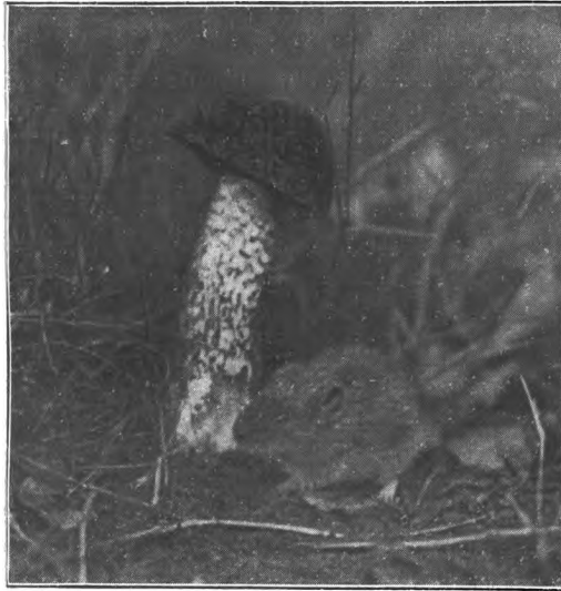
Waldmaus am Birkenpilz

Zu unserem Artikel „Pilznahrung höherer Tiere“ von Rud. Zimmermann.