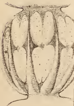
Fig. 4 a