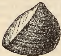
Myophoria laevigata GF. sp. Schaumkalk. Rüdersdorf. Berliner Museum.

Schloss normal. Die Sculptur besteht aus feinen Anwachsstreifen. Hinterseite der Schale meist durch Arealkante abgegrenzt. Devon bis Trias.