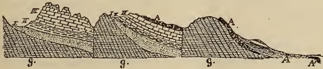
Fig. 2. Profil zwischen Bir el Inglis und der Küste des Roten Meeres.

mit der jetzt im Roten Meer lebenden F. Ehrenbergi KLUNZ., die zweite gehört zu Cyphastraea chalcidicum FORSK., und die dritte blieb infolge ihres allzu mangelhaften Erhaltungszustandes unbestimmbar (in Betracht kämen Acanthastraea , Favia und Prionastraea ). Zwischen den Korallen finden sich Stöcke von Lithothamnium . Nach dem Charakter dieser genannten, allerdings sehr formenarmen Fauna dürfte diese Riffbildung nicht sehr jung, vielleicht sogar noch pliocän sein: eine Annahme, mit welcher auch ihre bedeutende Erhebung über den Meeresspiegel in Einklang stehen würde. Unter den vier bestimmbaren Arten findet sich nämlich Cyphastraea chalcidicum sowohl in ägyptischen Miocänbildungen als auch noch lebend im Roten Meer, sie kann daher bei der Altersbestimmung ausser Betracht bleiben. Von den drei anderen Arten sind nun zwei, Favia und die erwähnte Orbicella , jedenfalls neu bezw. lebend nicht bekannt, während die dritte, Coscinaraea monile , zwar noch lebend im Roten Meer vorkommt,