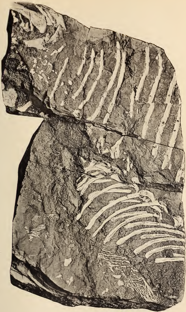
Naosaurus Credneri JKL.