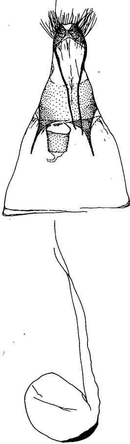
Abb.2: Lithocolletis (= Phyllonorycter ) macedonica n.sp. Paratypus Ventralansicht des weiblichen Genitales. Etiketten im Text.

erweiternden Feld schwacher, gleichförmiger Setae. Sacculusfortsatz*) breit konisch, das kurze, dornförmige Filament gegen den Dorsalrand gebogen, etwa bis 1/4 reichend. Uncus sehr schmal, ohne Setae, die Valven etwas überragend. Aedoeagusspitze vor den Valvenspitzen. Saccus schmal und kurz. Ventralschuppe (Lappen des 9. Sternites) breit spatelförmig.