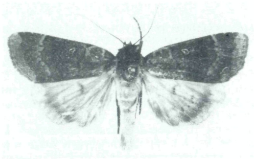
Abb. 1. Sineugraphe carvalhoi n. sp.

Holotypus ♂: Acores, Pico, über Siveira, 600 m, 5. VII. 1981. – Paratypen: 1 ♂, 1 ♀ mit den gleichen Funddaten; 1 ♂ Pico, Magdalena, 11. VII. 81; 1 ♂ Terceira, Pao Velho, 430 m, 13. VII. 81; 2 Exemplare dt. 11. VII. 81 sowie alle bei dieser Expedition von Carvalho und Camões gefangenen Stücke.