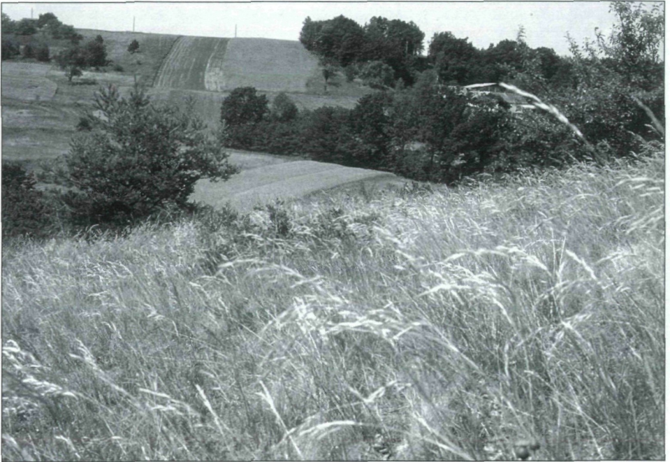
Abb.2.: Die Xero- und Mesobrometen am Tobajer Kogel NW Güssing stellen für eine Vielzahl interessanter Insekten-Arten Lebensraum dar.