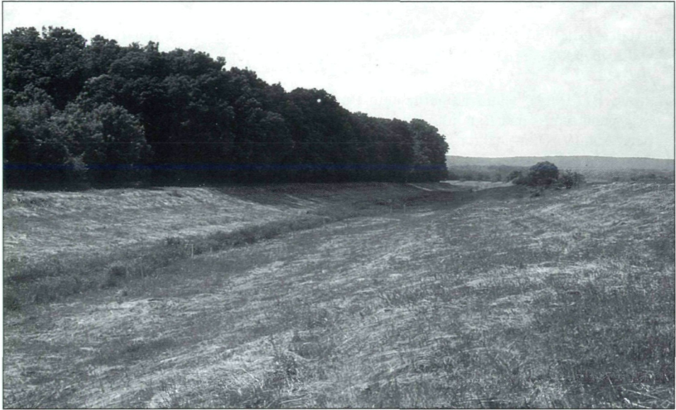
Abb. 6.: An den gemähten Grabenrändern und der anschließenden Glatthaferwiese bei Luising kam Pentophera morio 1995 in hoher Individuendichte vor.