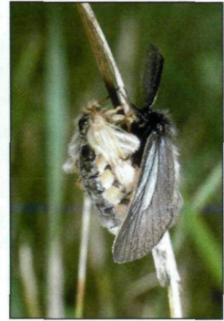
Abb. 5.: Die Weibchen der pontomediterran verbreiteten Pentophera morio sind bekannterweise brachypter.