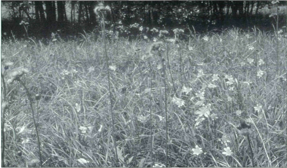
Abb. 1.: Das NSG Luka bei Großmürbisch ist u.a. für seine herrlichen Hemerocallis lilioasphodelus -Bestände bekannt.

Sanden oder vergleht); in den Tälern herrschen Pseudogley- und Gleyböden vor (GERGER 1994).