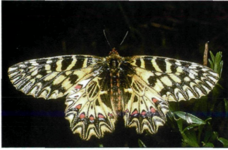
Abb. 3.: Zerynthia polyxena wird in Österreich als „vom Aussterben bedroht“ eingestuft.