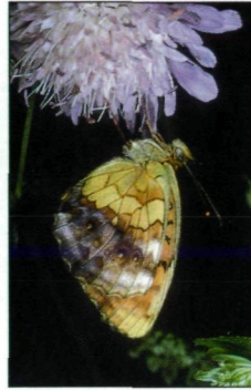
Abb. 4.: Die an Waldmäntel gebundene Brenthis daphne konnte nur einmal bei Großmürbisch festgestellt werden.