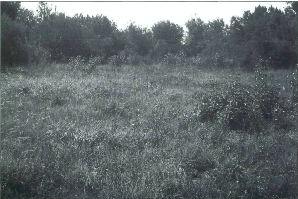
Abb. 2: Seiherrwiese I, am 12.8.1998, NW-Ecke.