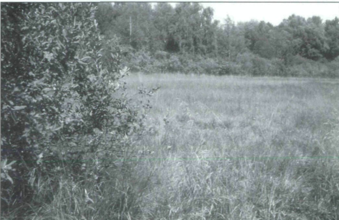
Abb. 5: Seiherwiese IV, am 12.8.1998, NW-Hälfte, Blick von der Seiherwiese IIIb Richtung Norden.