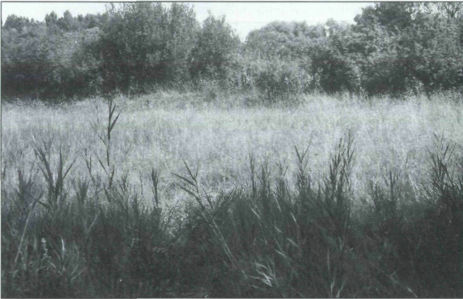
Abb. 4: Seiherwiese IIIb, am 12.8.1998, NO-Teil.