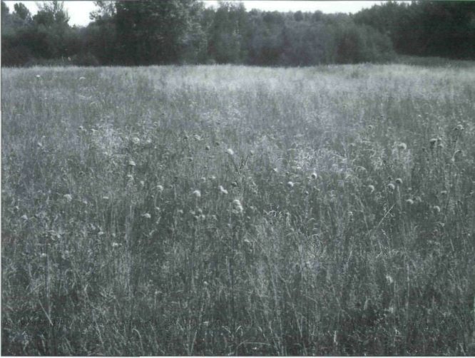
Abb. 3: Seiherwiese II, am 12.8.1998, von der Straße aus Richtung Norden, dem trockeneren Teil der Wiese.