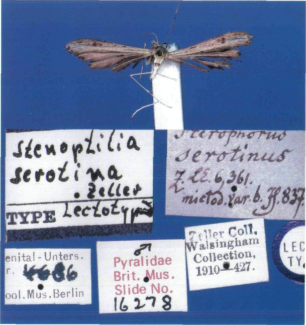
Abb. 1: Stenoptilia serotina (ZELLER, 1852). Typus.