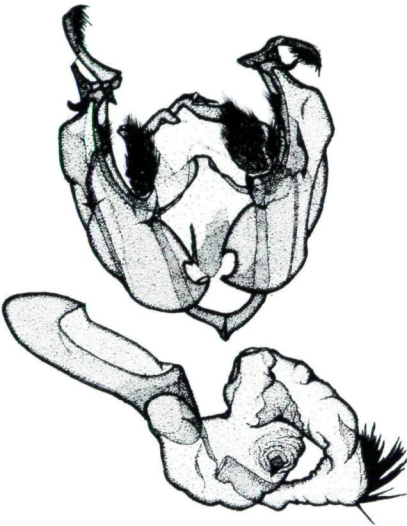
Abb. 3: Genital ♂, Lacanobia (Diataraxia) hreblayi sp. n., Holotypus