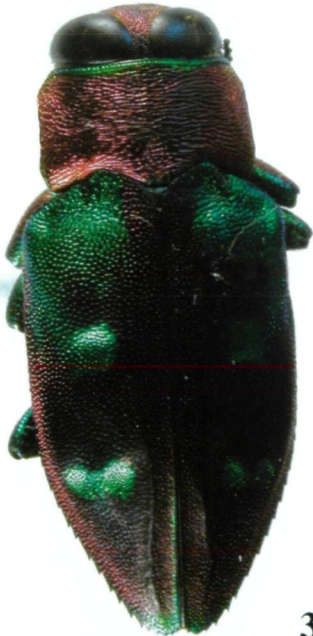
Abb. 1: C. jendeki sp.n. (Holotypus)