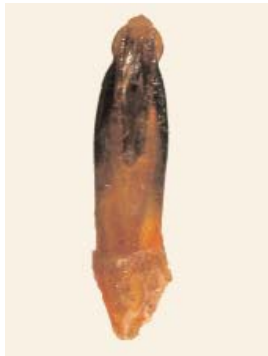
Abb. 3: C. skalei sp. n. (Holotypus) ♂, Aedeagus, dorsal (Länge: 3,5 mm)