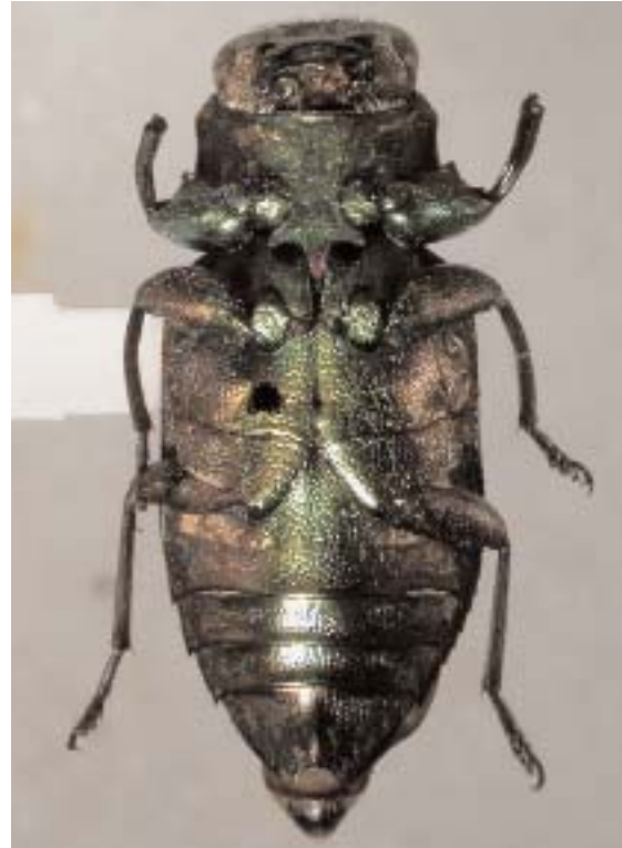
Abb. 2: C. gerstmeieri sp. n. (Holotypus) ♂, ventral (Länge: 11,8 mm)