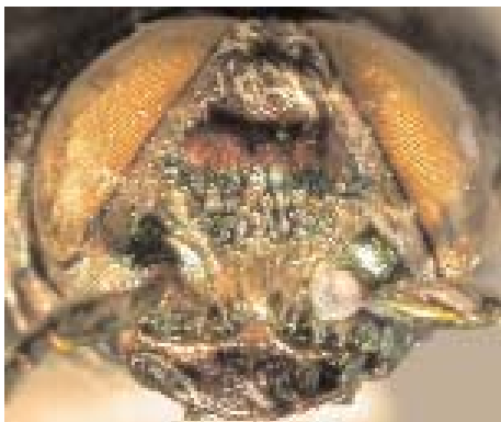
Abb. 6: C. skalei sp. n. (Holotypus) ♂, Clypeus