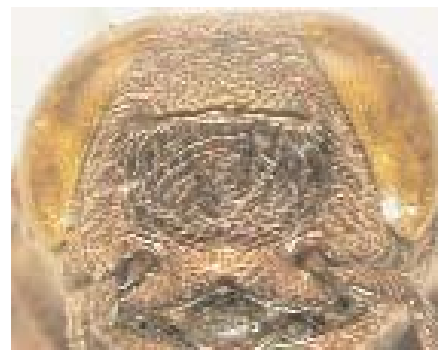
Abb.21: C. bistrispunctata (Holotypus) ♂, Clypeus