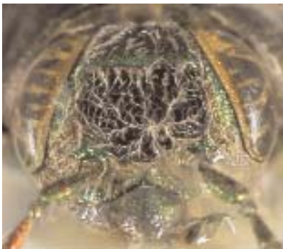
Abb.22: C. indica (Ambon) ♂, Clypeus