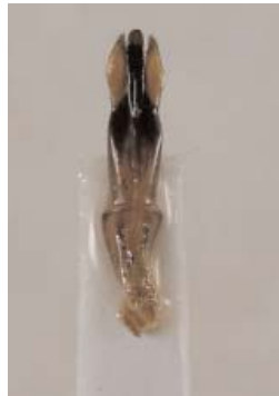
Abb. 4: C. gerstmeieri sp. n. (Holotypus) ♂, Aedeagus, dorsal (Länge: 4,1 mm)