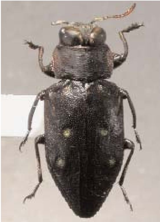
Abb. 1: C. skalei sp. n. (Holotypus) ♂, dorsal (Länge: 11,2 mm)