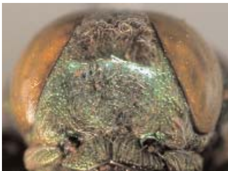
Abb.12: C. philippinensis (Holotypus C. talautana ) ♂, Clypeus