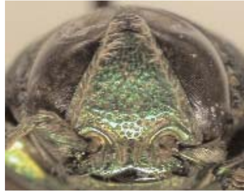
Abb. 7: C. auricornis (Lectotypus) ♀, Clypeus