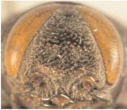
Abb. 8: C. auricornis (Paralectotypus) ♀, Clypeus