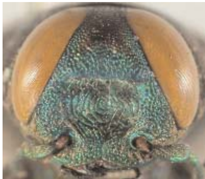
Abb.10: C. arouensis (Holotypus) ♂, Clypeus