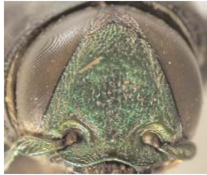
Abb. 9: C. ignipicta (Holotypus) ♂, Clypeus