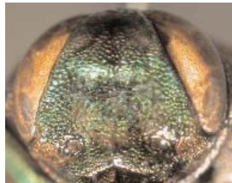
Abb. 5: C. gerstmeieri sp. n. (Holotypus) ♂, Clypeus