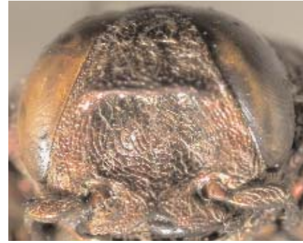
Abb.17: C. shortlandica (Holotypus) ♀, Clypeus