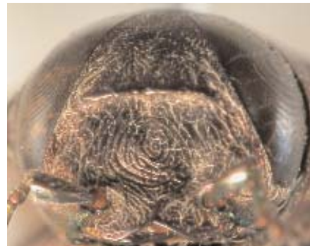
Abb.19: C. purpureicollis (Holotypus) ♂, Clypeus