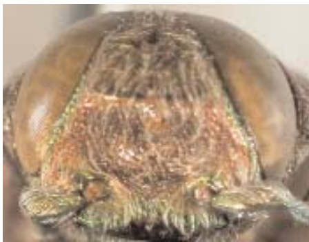
Abb.20: C. vicina (Holotypus) ♂, Clypeus