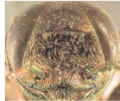
Abb.23: C. indica (Holotypus) ♀, Clypeus