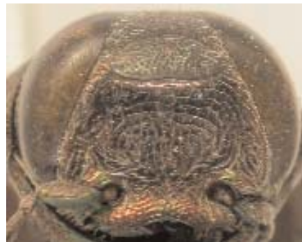
Abb. 13: C. tristis (Paralectotypus) ♀, Clypeus