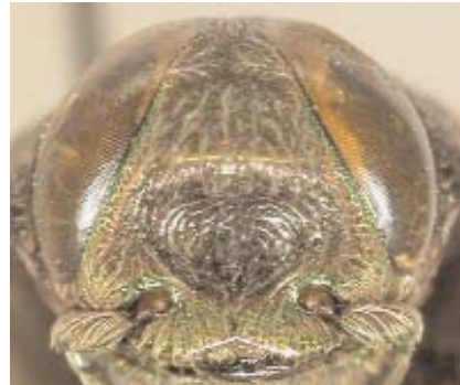
Abb.11: C. chrysonota (Lectotypus) ♂, Clypeus