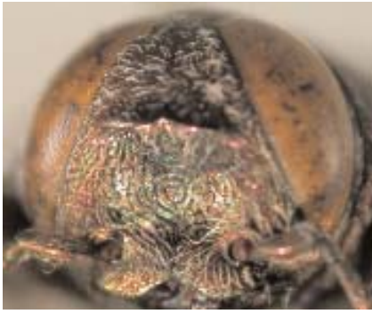
Abb.16: C. auropunctata (Lectotypus) ♀, Clypeus