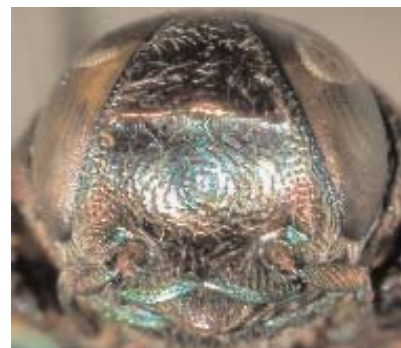
Abb. 15: C. dubiosula (Holotypus) ♀, Clypeus