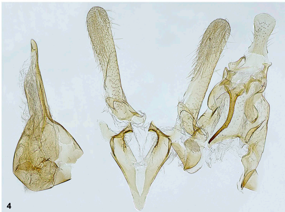
Abb.3–4: Helcystogramma albinervis : (3) Männlicher Falter vom 13.VIII.2005; (4) Genital des selben Exemplars. © Peter Buchner.