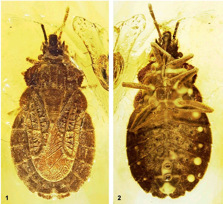
Abb. 1–2: Holotypus von Aradus penteneuros sp.n., dorsal (1) und ventral (2).

Beschreibung des makropteren Weibchens: Körperoberfläche, Fühler und Beine mit feiner Granulierung. Färbung hellbraun, teilweise angedunkelt.