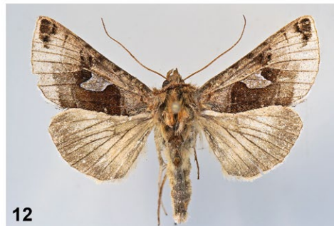
Abb. 7–12: (7) Coleophora ericarnella ; (8) Scythris limbella ; (9) Choreutis diana ; (10) Cydia corollana ; (11) Merulempista cingillella ; (12) Autographa aemula . Alle Bilder zeigen im Text angeführte Exemplare.