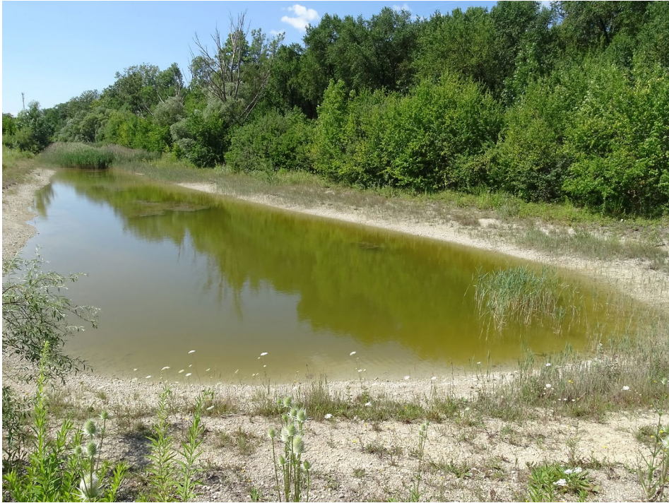
Abb. 1: Nordteil des Gewässers in Matzendorf-Hölles, Niederösterreich, 17. Juli 2022.

von C. scitulum am Rand ihres Verbreitungsgebietes zeigten, dass Gründereffekte nicht auftreten, d. h., dass die genetische Diversität erhalten bleibt (SWAEGERS et al. 2013, 2014, 2015). Dies wird damit erklärt, dass es an der breiten Ausbreitungslinie durch migrierende Individuen vermutlich laufend zur genetischen Durchmischung kommt. Bereits verpaarte und als Einzeltiere auftretende Weibchen könnten zur genetischen Differenzierung beitragen. Das oben beschriebene Paarungsverhalten mit der mehrmaligen Trennung des Paarungsrades mag die vorzeitige Lösung der Kopplung begünstigen, wobei der vorangegangene Paarungsprozess für die Stimulation des Weibchens zur Eiablage ausreichen könnte. Es fragt sich dann allerdings, weshalb Solo-Eiablagen nicht öfter beobachtet werden (CHOVANEC & WILDERMUTH 2017).