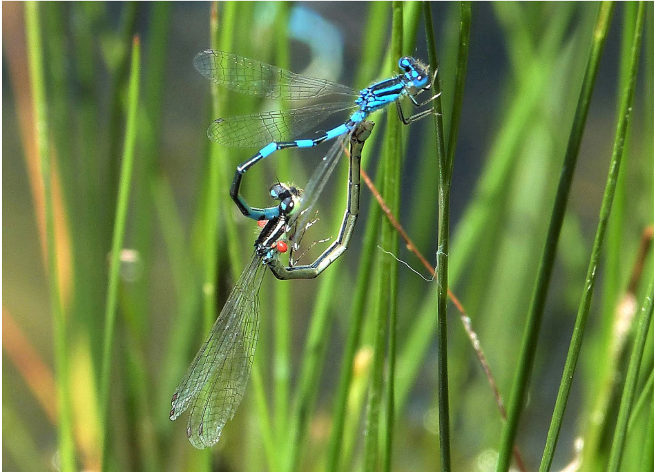
Abb. 7: Kopula von Coenagrion scitulum . Enzersdorf, 11. Juni 2022. Thorax des Weibchens mit Befall durch Limnochaes aquatica .

beispielsweise an einem Standort in Maria Enzersdorf (Niederösterreich) nachzuweisen, an dem C. scitulum – allerdings in deutlich geringeren Abundanzen – gefunden wurde (CHOVANEC 2017b, CHOVANEC & WILDERMUTH 2017).