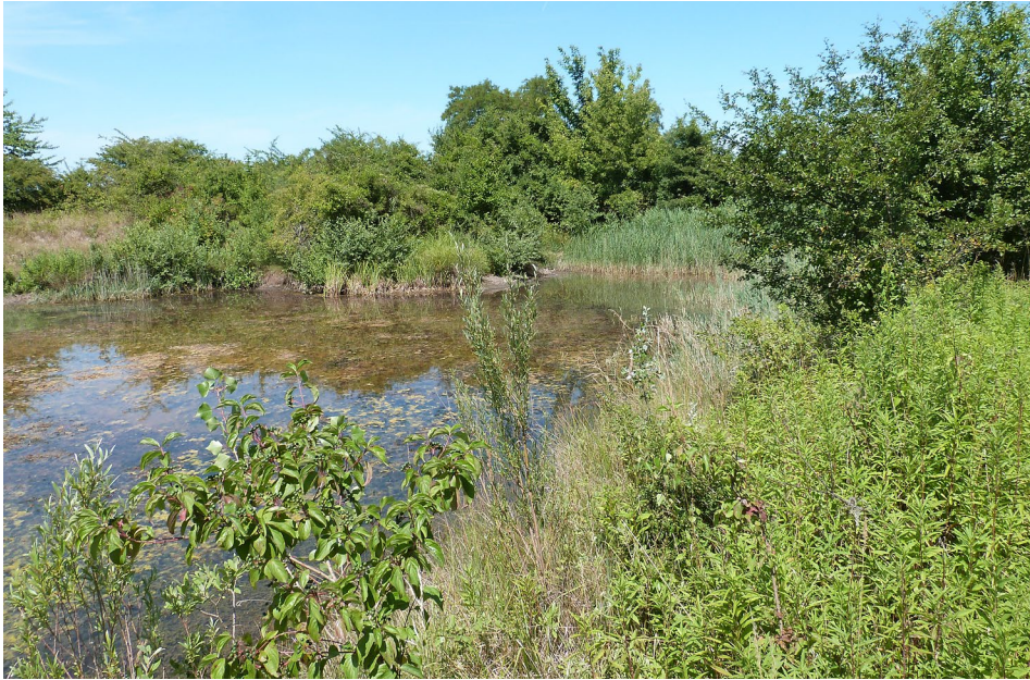
Abb. 2: Blick vom Ostufer des Gewässers in Enzersdorf an der Fischa, Niederösterreich, auf das nordwestliche Ufer mit Röhrichtbewuchs, 17. Juli 2022, © K. Schaufler.

wurden, um den Wasserrückhalt zu verbessern, Abschwemmungen zu verringern, den Rückhalt von erodiertem Material zu erhöhen und ein Angebot an aquatischen Lebensräumen zu schaffen. Das Gewässer (285 m ü. A.; geografische Länge 16°12'29", Breite 47°53'46") wurde in den Jahren 2013 und 2014 an einer Stelle angelegt, an der bereits eine Vernässung bestand. Das Becken hat eine schmale, länglich-dreieckig bis keilförmige Form in Nord-Süd-Ausrichtung, und ist – abhängig von der Wasserführung – zwischen 40 und knapp 200 m lang und an der breitesten Stelle im Norden etwa 15–25 m breit. Bei mittlerer Wasserführung beläuft sich die Größe der Wasserfläche auf ca. 1.500 m 2 , die maximale Tiefe beträgt 50–70 cm. Die Ufer sind durchgehend flach. Der breitere Nordteil des Gewässers wird von einer offenen Wasserfläche und vegetationsarmen, kiesig/sandigen Ufern mit spärlichem Röhrichtbewuchs ( Phragmites australis ) geprägt. Potamogeton pectinatus und Najas marina bilden aufschwimmende Bestände. Dieser Bereich ist der flächenmäßig größte Teil des Gewässers mit einer wasserstandsabhängigen Breite von etwa 15–25 m und einer Länge von 40–60 m (Abb. 1). Dieser Gewässerabschnitt wies während der Untersuchungsjahre 2021 und 2022 permanente Wasserführung auf.