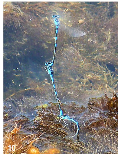
Abb. 8–10: Eiablagen von Coenagrion scitulum. (8) Die Stellung des Tandems in der Bildmitte entspricht dem „ Sympecma -Typ“. Eine Milbenlarve an der Wasseroberfläche ist auf der Suche nach einem Wirt (Pfeil). Enzersdorf, 11. Juni 2022. (9) Ein Weibchen (rechts) weist starken Befall durch Limnochares aquatica auf. Auch hier ist eine Milbenlarve auf Wirtssuche zu erkennen (Pfeil). Enzersdorf, 11. Juni 2022. (10) Nachweis einer Fehlkopplung bei C. scitulum in Form eines homospezifischen Triple-Tandems. Enzersdorf, 17. Juli 2022.