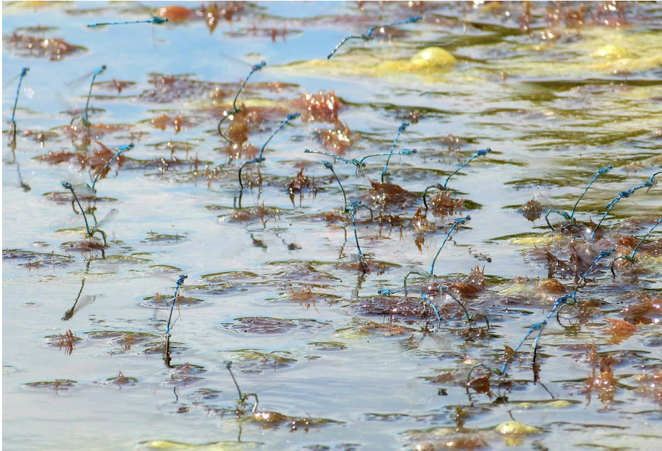
Abb. 6: „Massenhaftes“ Auftreten von Coenagrion scitulum mit Eiablagen. Enzersdorf, 11. Juni 2022.

waren seitlich am Thorax angeheftet. Selten befanden sich Milben dorsal zwischen den Flügelbasen. Nur an sehr wenigen Individuen waren Milben am Abdomen von C. scitulum zu erkennen. Beispielsweise ist bei Vergrößerung von Abbildung 6 ein entsprechendes Tandem zu sehen, bei dem der Befall des Männchens am zweiten Abdominalsegment dorsal, jener des dazugehörigen Weibchens am gleichen Segment ventral zu erkennen ist. Bei einem Männchen befand sich eine Milbe am Tergum des achten Abdominalsegmentes.