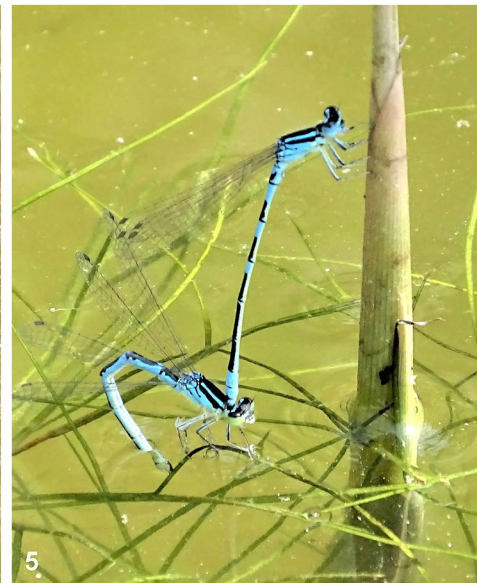
Abb. 3–5: (3) Eiablagen von Coenagrion scitulum in Matzendorf, 13. Juli 2021. (4) Die Position des Männchens in schiefer „Wachturmhaltung“ mit heftigem Flügelschlag ist auch typisch für Erythromma viridulum ; die Stellung des Tandems dieser Art (im Vordergrund) entspricht allerdings hier dem „ Sympecma -Typ“ (BUCHHOLZ 1950). Die Ventralseite des Thorax des Männchens von E. viridulum lässt einen Befall durch Arrenurus sp. erkennen. Matzendorf, 13. Juli 2021. (5) Das Männchen hält sich an einem Röhricht-Halm fest und daher die Flügel ruhig. Matzendorf, 29. Juni 2021.