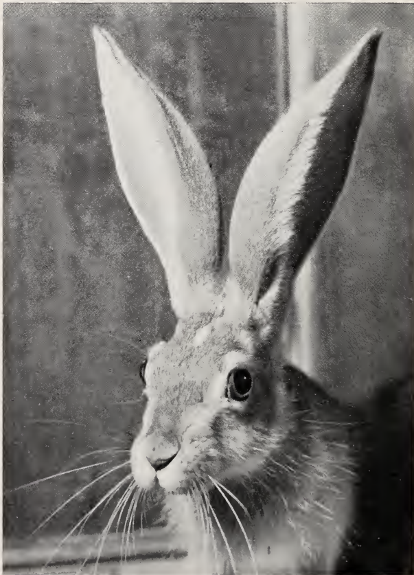
Fig. 1. Lepus capensis Linné 1758. Forme du Sahara

Un passage progressif de formes très pigmentées de grande taille ou de taille moyenne à des formes pâles et de petite taille, peut-être observé en Afrique du Nord, et notamment depuis le Nord du Maroc, où vit L. capensis schlumbergeri (forme comparable par le pelage et les dimensions aux formes méditerranéennes de L. europaeus ) jusqu'au Sahara, où vivent des Lièvres de petite taille très peu pigmentés et dont les oreilles peuvent être très longues (Fig. 1).