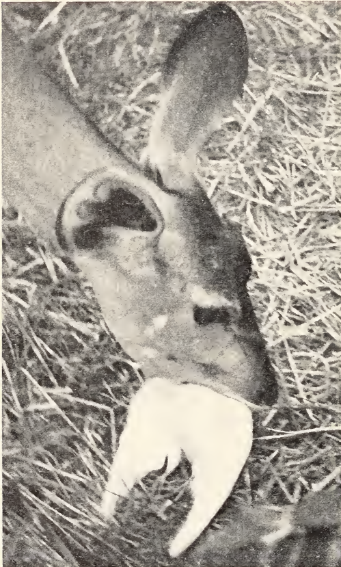
Abb. 2. Großer Kudu ( Strepsiceros strepsiceros ) beim Dekapitieren einer Taube

die Frage auf der Hand, wie sich die Weibchen von denjenigen Arten, die normalerweise Fleischnahrung verweigerten, sich in der Zeit kurz nach der Geburt verhalten.