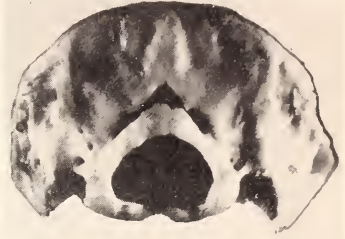
Abb. 3. Assimilatio atlantis durch Occipitalmanifestation bei Ondatra zibethica (Eing.-Nr. 56/729 ♂)