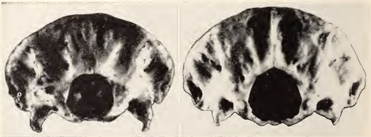
Abb. 1. Normale Variationsbreite der Hinterhauptsregion von Ondatra zibethica (Weibchen, Eing.-Nr. 56/208 und 56/229)

Die Beziehungen zwischen Größe des Foramen magnum und dem Hirnvolumen hat schon BROCA (1868) behauptet, ohne allerdings Beweise dafür anzutreten. PETROFF (1932) fand sowohl bei brachykephalen (Bayern) als auch bei dolichocephalen