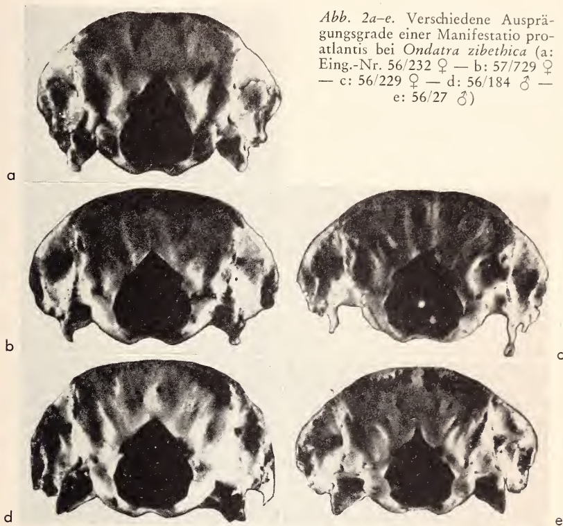
Abb. 2a-e. Verschiedene Ausprägungsgrade einer Manifestatio proatlantis bei Ondatra zibethica (a: Eing.-Nr. 56/232 ♀ — b: 57/729 ♀ — c: 56/229 ♀ — d: 56/184 ♂ — e: 56/27 ♂)

Schädel mit einem großen Foramen magnum (relativ große Strecke Basion — Opisthion) sind der funktionelle Ausdruck für einen beweglichen Kopf, Schädel mit kleinem Foramen magnum deuten auf einen fixierten Kopf. Die Wechselwirkung von dynamischer funktioneller Anpassung und statischer funktioneller Gestalt bedingt bei beweglichem Kopf auch eine höhere Variabilität der Foramina-Verhältnisse. Ondatra