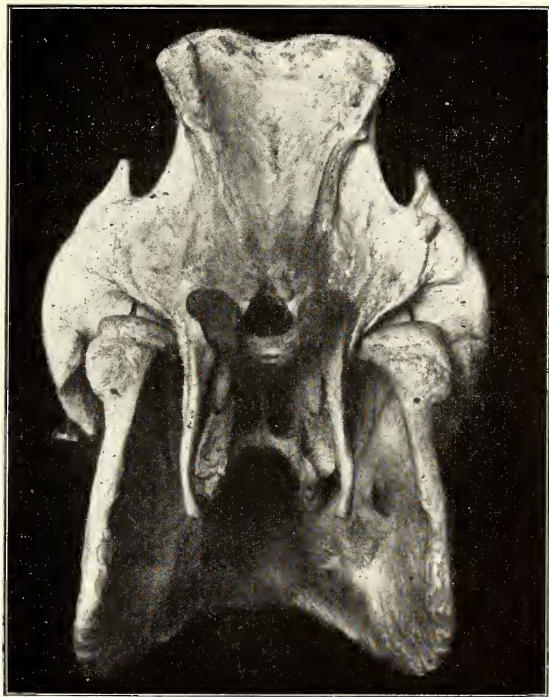
Abb. 2. Derselbe Schädel wie Abb. 1 von hinten gesehen.

die Condylen des Occipitale um einige mm nach hinten. Sie selbst zerfallen in einen nasalen glatten und einen kaudalen rauhen Höcker. Die größte Entfernung voneinander erreichen die aufsteigenden Ränder der Kieferäste in ihren unteren Abschnitten, um sich im Bereiche der Condylen zu nähern. Die Kieferäste sind demzufolge von hinten gesehen nach unten und außen gespreizt. Der Abstand der Condylen von der Grundfläche verhält sich zum Abstand der Mitte des Occipitalkammes von der Grundfläche wie 1:1,7.