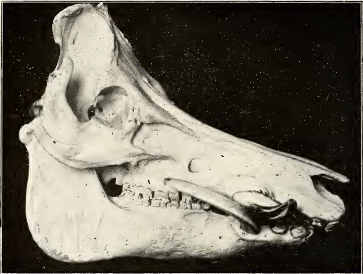
Abb. 1. Schädel eines achtjährigen bayerischen Landschweinebers.

und abwärts gerichtet, wobei ihnen in fast gleicher Richtung die unteren Schneidezähne (I 1) entgegenkommen. Vom Schneidezahnrad ab läuft die untere Profilkontur leicht konkav zum Kinnwinkel. Die Sehne dieser Linie bildet mit der Horizontalen einen Winkel von ca. 20°. Die kaudale Konturlinie ist in ihrem oberen Abschnitt durch die schräg nach vorn geneigte Occipitalschuppe gegeben. Letztere wird nach hinten durch die Condylen überragt, die so die hintersten Punkte des Craniums tragen. Der untere Abschnitt der Konturlinie wird durch den leicht geschweiften, in seiner Tangente aber senkrecht zur Horizontalen stehenden hinteren Rand des Unterkiefers dargestellt.