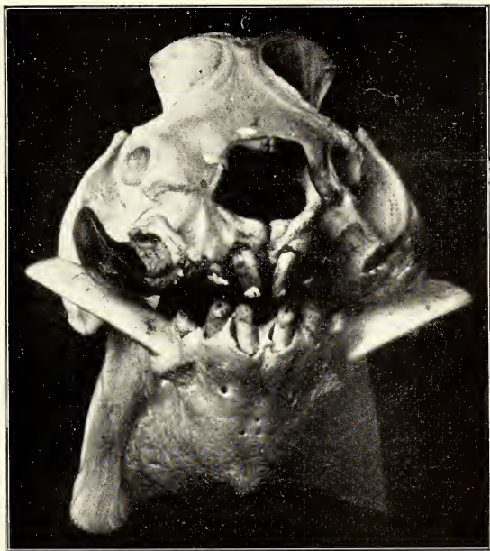
Abb. 4. Vorderansicht des Gebisses des Schädels von Abb. 1.

Die Zähne sind bei dem Eber alle noch vollständig vorhanden. Die Incisivi stellen walzenförmige Gebilde mit allseitig abgerundeten