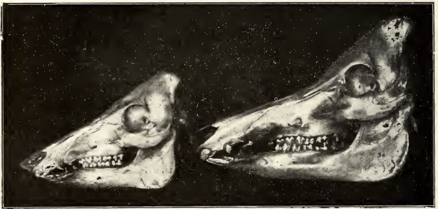
Abb. 5. Schädel bayerischer Landschweine, 6 und 18 Monate alt.

Durch die Betrachtung einer Reihe von Schädeln des bayerischen Landschweins, die ich nach steigendem Alter geordnet habe, sind, besonders was die Vorwärtsneigung der Occipitalpartie anbetrifft, ausschließlich Einflüsse von Haltung und Ernährung außer Betracht zu ziehen. Es ist eindeutig festzustellen, daß die Einknickung allmählich im zunehmenden Alter auftritt und bis zu den beschriebenen Ausmaßen im höheren Alter zunimmt. Ich muß mich in vorliegender Arbeit auf die bildliche Wiedergabe zweier Schädel, die das Auftreten der Ein-