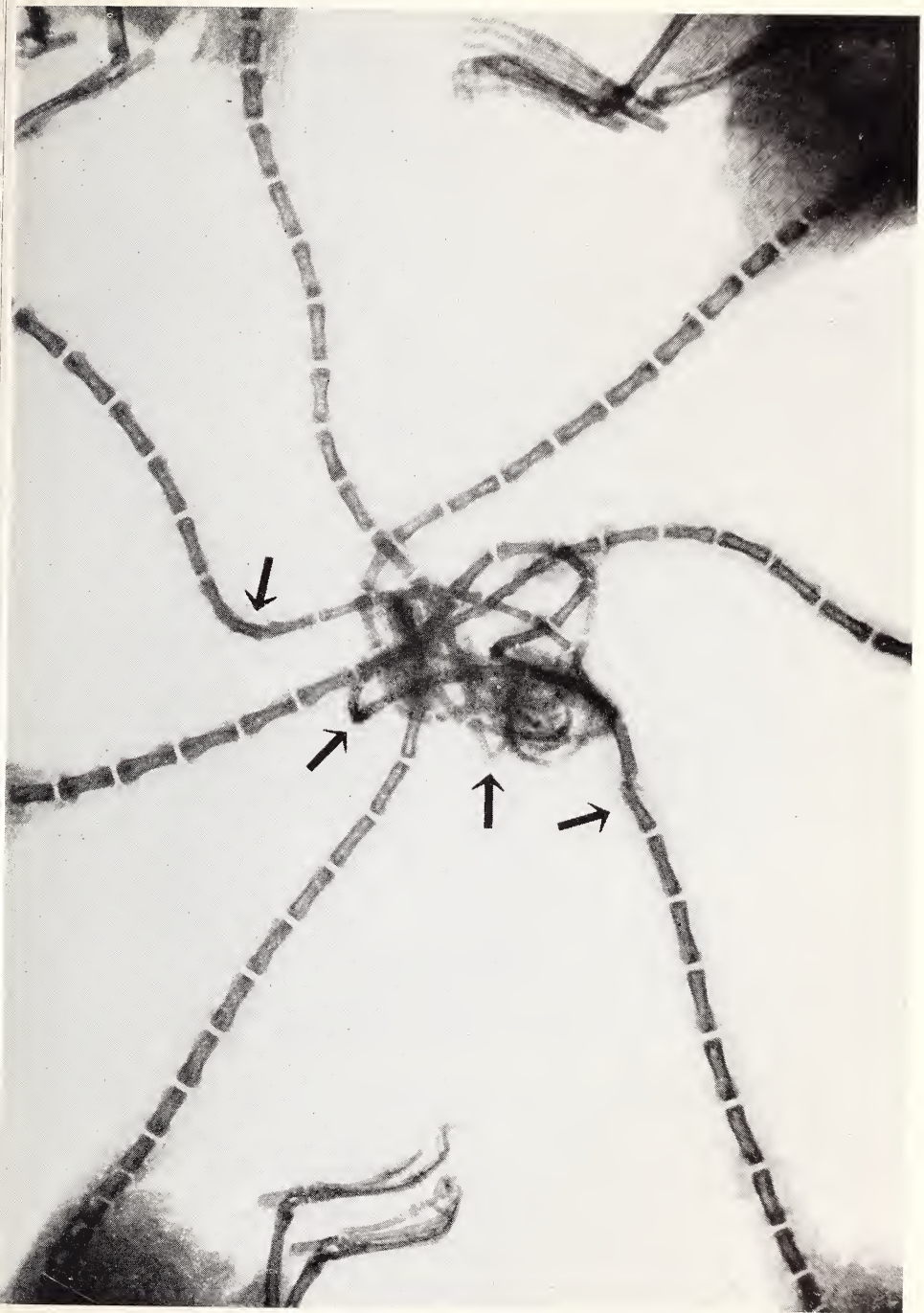
Abb. 3. Röntgenaufnahme der Schwänze mit dem Knoten