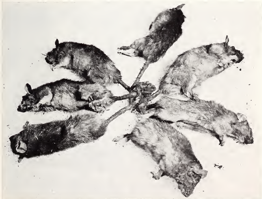
Abb. 1. Der Rattenkönig von Rucphen

In dieser Veröffentlichung ist alles gesammelt, was über Rattenkönige in Europa und anderswo bekannt ist, zusammen mit einem vollständigen Literaturverzeichnis. In Anbetracht der eingehenden Behandlung dieses Gegenstandes in der obengenannten Veröffentlichung brauche ich nur noch meinen Fund eines Rattenkönigs mit einer Beschreibung davon bekanntzugeben.