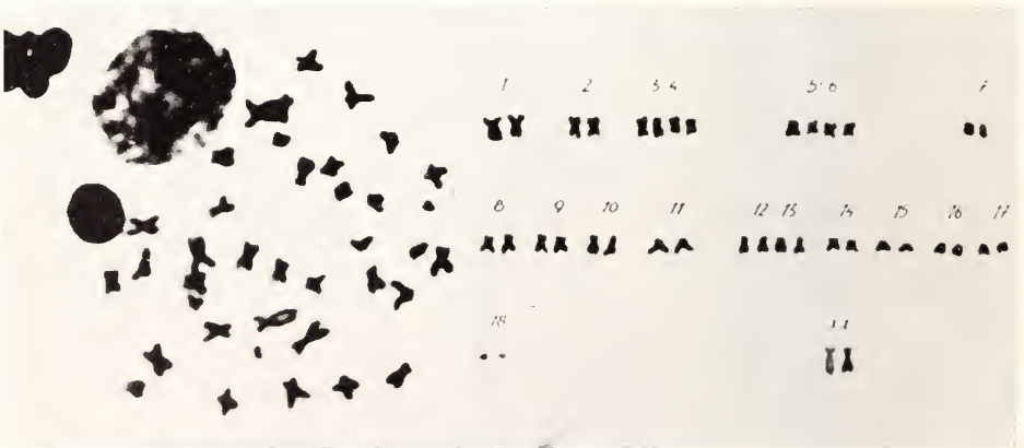
Fig. 1a (gauche). Divisions diploïdes chez une femelle de Mesocricetus newtoni — Fig. 1b (droite). Caryotypes de la figure 1a.

Les chromosomes sexuels n'ont pas pu être identifiés avec une précision absolue à cause de la saison qui n'a pas permis d'étudier la méiose chez les mâles. Malgré cela, il fut possible d'identifier les chromosomes sexuels, à l'aide du caryotype de la femelle chez laquelle on a constamment observé la présence d'une paire de grands chromosomes submetacentriques (XX), tandis que chez le mâle il n'y avait qu'un seul chromosome de ce genre (X) et un chromosome submetacentrique plus petit (Y). Le chromosome Y