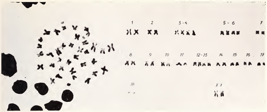
Fig. 2 a (gauche). Divisions diploïdes chez une femelle de Mesocricetus newtoni — Fig. 2 b (droite). Caryotypes de la figure 2 a.

étant très semblable à la paire de chromosomes submétacentriques 15 et 16, il est possible qu'ils soient confondus les uns avec les autres.