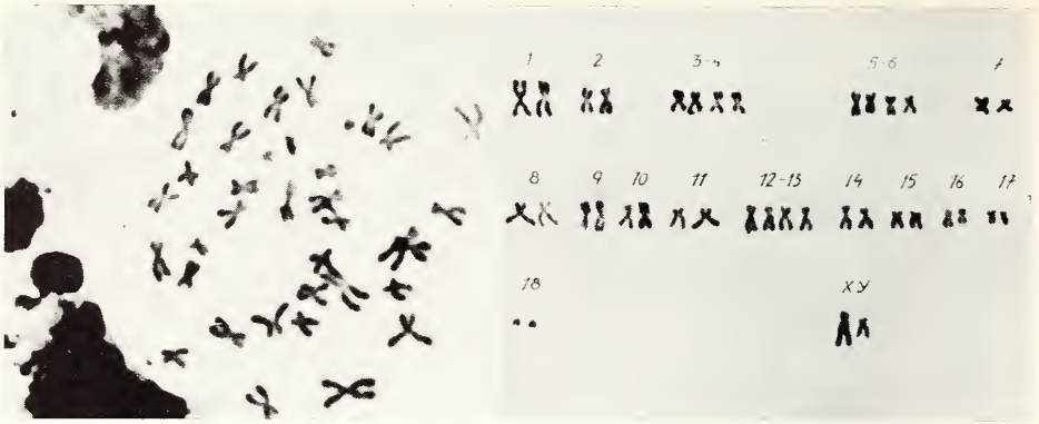
Fig. 4 a (gauche). Divisions diploïdes chez une male de M. newtoni — Fig. 4 b (droite). Caryotypes de la figure 4 a.

Cette hypothèse relativement à l'évolution du caryotype correspond partiellement aux données de la littérature de spécialité (R. MATTHEY, 1964).