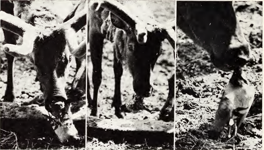
Abb. 2. Wapitihirsch ( Cervus elaphus canadensis ) mit frischtoten Taube

Zur Eindämmung des Befalls mit verwilderten Haustauben und neuerdings auch Türkentauben ( Streptopelia decaocto ) werden in unserem 30 ha großen Zoogelände im Jahresdurchschnitt mehrere Hundert dieser Vögel – meist morgens – mit dem Kleinkalibergewehr geschossen, wobei ein gewisser Prozentsatz unvermeidlicherweise in besetzte Gehege fällt. Daß bei dieser Gelegenheit einmal eines unserer Zwergflußpferde