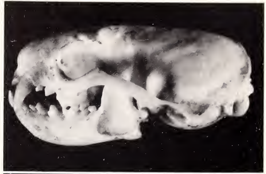
Abb. 5 (unten). Norma basilaris visus von V. p. euxina Pocock, ♀ ad., Lukovit, 28. 5. 1955, No. 36

Abb. 4 (Mitte). Norma verticalis visus von V. p. euxina Pocock, ♀ ad., Lukovit, 28. 5. 1955, No. 36