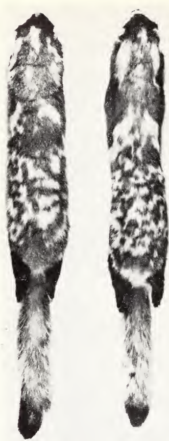
Abb. 6. Rückenzeichnung von Vormela peregusna euxina Pocock. — a. Kazanlak, 12. 4. 1959, No. 41, ♀ ad., b. Lukovit, 28. 5. 1955, No. 36, ♀ ad.

Der Grundton auf dem Rücken von V. peregusna euxina ist hell- bis dunkelbraun mit zahlreichen grellen Flecken und Streifen von gelber oder gelblicher Farbe, was die Zeichnung dieses Tieres sehr bunt macht. Im Gebiet der Schulterblätter bilden sich skapulare, verschieden breite Streifen von unregelmäßiger Form, die sich durch ihre braune Zeichnung, die verschiedene Intensität aufweist, unterscheiden (Abb. 6). Über den Augen verläuft ein breiter, weißer Querstreifen, Stirnbinde genannt (OGNEV, 1935), der nach rückwärts zwischen Ohr und Auge durchläuft, zur Kehle herabsteigt und unter dem Ohr als unterbrochener Halbbogen endet (Abb. 2, 7, 9). Die ganze Schnauzen- und Kinnpartie ist rein weiß. Die Ohren sind am Ende mit langen weißen Haaren bedeckt. Im Nackengebiet befinden sich drei weiße Streifen, die allmählich in ihrem rückwärtigen Teil gelblich werden. Für die Westformen sind diese drei Streifen charakteristisch: ein mittlerer, dünner und zwei seitliche breitere. Bei den östlichen mittelasiatischen Tigeriltissen verschmelzen diese drei Streifen in einen weißen Querstreifen, von dem sich drei Fortsätze absondern. Der Schwanz ist verhältnismäßig locker, länger als bei M. putorius und mit gelbgrauen Wollhaaren (Fellhaaren) mit einer Beimischung von schwarzen Haaren bedeckt. An der Schwanzbasis und an den Seiten des Schwanzes befinden sich zwei längliche