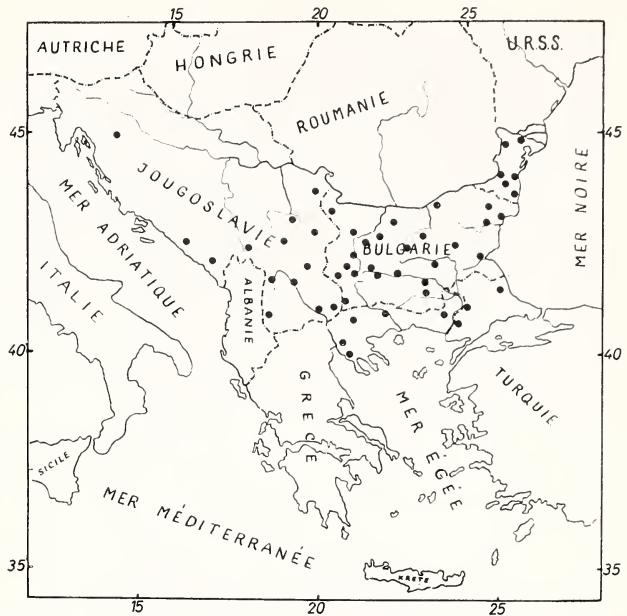
Abb. 1. Verbreitung von V. peregusna euxina Pocock in Bulgarien und auf der Balkan-Halbinsel

Ein Umstand ist ungeklärt! Die Städte Struga und Tetovo sind auf der eigentlichen albanisch-jugoslawischen Grenze gelegen, auch die Fundorte in Süd-Dalmatien sind in der Nähe dieser Grenze, aber trotzdem konnte dieser Iltis für Albanien noch nicht festgestellt werden. Auch sein Fehlen südlich und südwestlich von Solun in Griechenland ist auffallend.