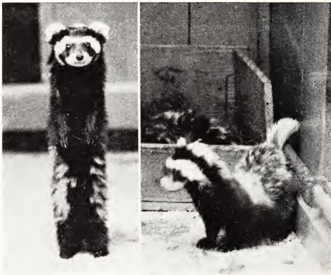
Abb. 9. Vormela peregusna ; lebende Tiere im Zoo Köln

V. peregusna ist vor allem ein Nachttier. Es verbringt einen erheblichen Teil seines Lebens im Bau, in welchem es auch schläft; es konnten aber Fälle beobachtet werden, in denen es während des Tages sein Schlupfloch verließ und in seinem Bezirk herumstreifte. In den Weinbergen östlich von Russe beobachtete ich am 20. 6. 1950 ein männliches und ein weibliches Exemplar von V. peregusna , die sich nicht weit von ihrem Bau entfernt sonnten. Bei meinem Versuch, mich ihnen mehr zu nähern, richtete sich das Männchen auf, lugte nach allen Seiten und fing schwach zu knurren an. Das