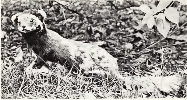
Abb. 2. Vormela peregusna euxina Pocock, ♂, montiertes Exemplar, Sofia, 20. 7. 1951