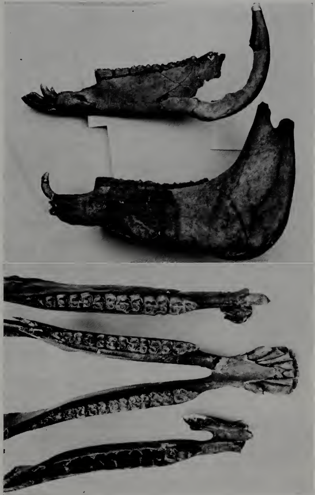
Abb. 3 (oben). Unterkiefer, oben Esel, unten Pferd, beide aus Römergrab — Abb. 4 (unten). Drei Unterkiefer von Esel (Römergrab)

Der Eselunterkiefer erscheint lang gestreckt, hat eine geringere Höhe, die Umrißlinie von Pars molaris ist gerade. Die Stellung der Schneidezähne des Ober- und besonders des Unterkiefers zu einander ist sehr kennzeichnend und bedingt die schmale Eselschnauze. Einen Vergleich von der Zahnstellung beider Equidenarten kann man gut durch die Fingerhaltung einer offenen menschlichen Handfläche wiedergeben, nämlich beim Pferd durch flach nebeneinanderliegende Finger, beim Esel durch eng ein-