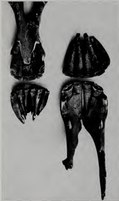
Abb. 5. Schneidezähne, links Esel, rechts Pferd (Römergrab)

Die Südpferde dagegen unterscheiden sich grundsätzlich durch eine getrennte Anordnung der Prämolaren und Molaren. Während Prämolaren mit ihren Hochachsen mehr parallel stehen, sitzen die Molaren schräg im Winkel zwischen Mandibelcorpus und Ramus. Beim Nordpferd sind jedoch alle Mahlzähne derart gleichmäßig in Radspeichenform gestellt, daß es in den Röntgenaufnahmen sofort auffällt. EBHARDT erklärt es so, daß härter werdendes Futter der kalten Gebiete einen erhöhten Kaudruck erforderte,