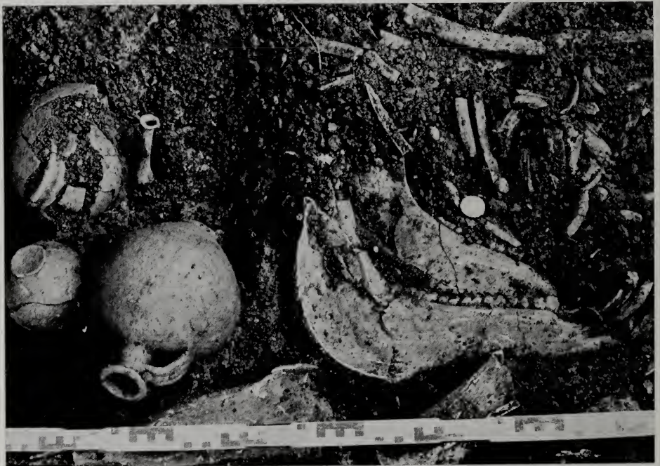
Abb. 1. Eselunterkiefer mit Münze (Kaiser Trajan); Grab aus der Römerzeit

Da diese hier freigelegte Grabstätte in früherer Zeit schon gestört worden ist, liegen