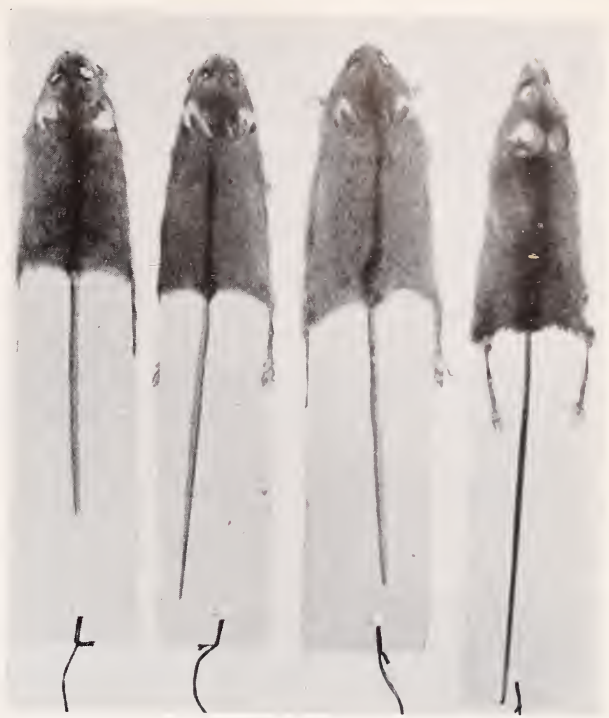
Abb. 4. Der Balg von D. kabuziensis (rechts) im Vergleich mit den anderen Arten. Von links: D. mystacalis , D. melanotis , D. mesomelas . Man beachte Schwanzlängen und Aalstriche