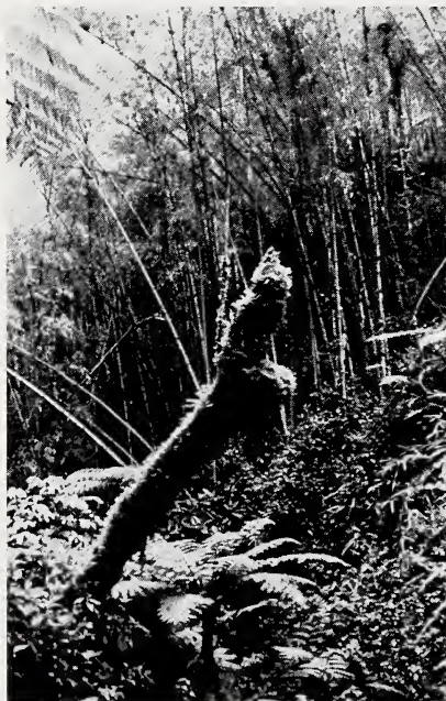
Abb. 1. Vegetation nahe des Fangortes: Bambus, Unterholz, Baumfarne

Die Schlucht liegt unmittelbar nördlich, d. h. rechts der Straße Bukavu — Kisangani; ihre Koordinaten sind ungefähr 28.41 E und 2.17 S. Schluchtabwärts, immer entlang des Baches voranschreitend, stellten wir im