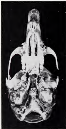
Abb. 3. Unterseite des Schädels von D. kahuziensis

Aus dem Vergleich der in der Tabelle gebrachten Maße ergibt sich: Die neue Dendromus -form ist ungefähr so groß wie D. mesomelas , die größte Art. Was sie äußerlich von ihr und allen andern bekannt gewordenen Formen unterscheidet, ist ihre extreme Schwanzlänge mit 132 mm (Abb. 4). Die größten aus der Literatur bekannten Längen sind: 117 mm bei mesomelas (HOLLISTER 1919), 105 mm bei melanotis (DIETERLEN, im Druck) und 101 mm bei mystacalis (DELANY/NEAL 1966). Auch in der KRL:SL-Relation steht kahuziensis mit 157% an der Spitze, sowohl im Kivu-gebiet wie auch allgemein; am nächsten kommen die Werte bei D. (melanotis) messorius von Kamerun mit 151% (EISENTRAUT, unveröff.) und bei D. mystacalis lineatus mit 144% (HATT 1940).