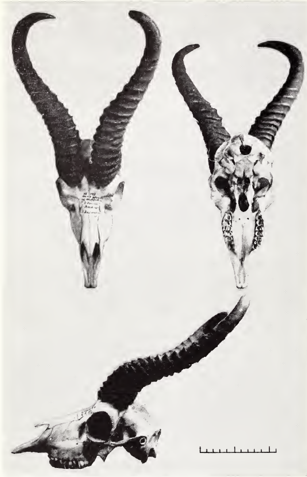
Abb. 2. Schädel von Antidorcas ♂ (Maßstab in cm)

Bevorzugte Weidepflanzen scheinen Rhigozum trichotomum und Arestida obtusa zu sein, aber auch Früchte und Knollen, die mit den Hufen freigescharrt werden, werden gerne gefressen. Die Tiere sind vom Wasser weitgehend unabhängig; sie suchen häufig Salzpfannen auf (ELOFF, 1962).