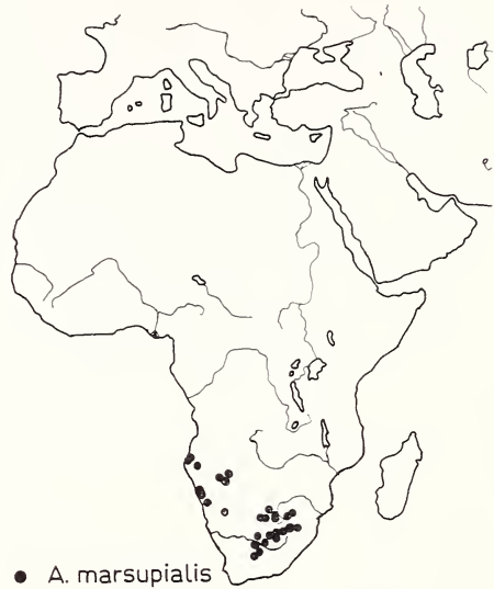
● A. marsupialis

Die Grenzen zwischen den einzelnen Unterarten sind fließend (ANSELL, 1968).