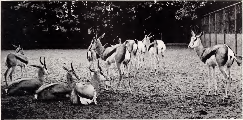
Abb. 1. Springbockherde im Zoo Krefeld

LATIMER, 1961), was die Bedeutung des „Gründereffektes“ (MAYR, 1942; GÜNTHER, 1962) hervorhebt. Jedoch handelt es sich bei den Tieren nur um teilmelanine Formen, bei denen die Blesse stets sehr gut entwickelt ist. Ähnliche Farbmutanten sind von der europäischen Gemse bekannt (NIETHAMMER, 1969).