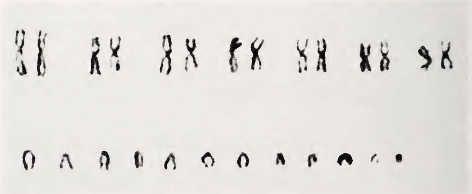
Abb. 2. Karyotyp von Tier Nr. 509, einem hellen Tier mit 14 metazentrischen Chromosomen, wie die Tabakmaus