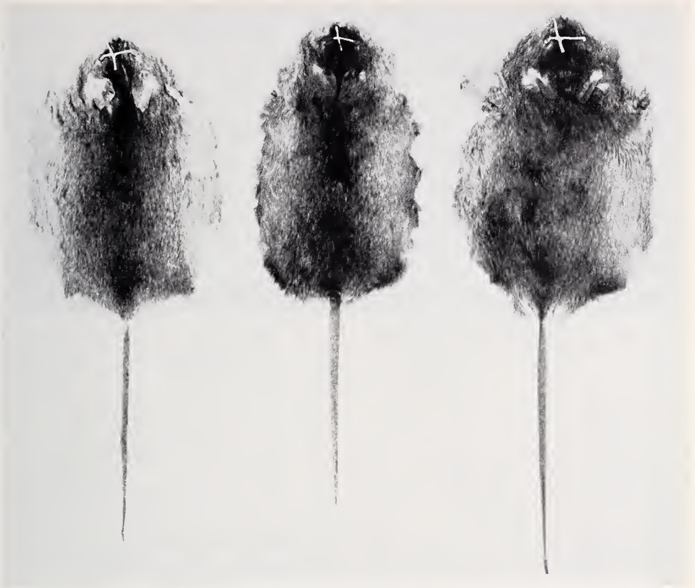
Abb. 1. Felle von einem „hellen“ RF_2 -Tier (Nr. 509), einer Tabakmaus und einem „dunklen“ RF_2 -Tier (von l. nach r.). Die Aufhellung wirkt sich besonders auf die Flanken der hellen Tiere aus.

den auf Tabakmäuse zurückgekreuzt. Von den RF_2 -Tieren und weiteren Kreuzungen inter se wurden Chromosomenpräparate angefertigt, die Felle präpariert und im Museum Koenig katalogisiert. Der Phänotyp wurde nach den Kategorien „hell“ und „dunkel“ eingeteilt, wobei „dunkel“ die Fellfarbe der Tabakmaus (zumindest annähernd), „hell“ die Färbung aller helleren Tiere bezeichnet. Drei Felle, die dieses Einstufungsprinzip verdeutlichen, sind in Abb. 1 dargestellt.