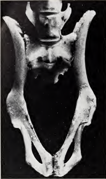
Abb. 3. Eliomys quercinus denticulatus . Das Becken eines jüngeren Schläfers (U.S.N.M. No 322758) mit noch nicht verwachsenen Scham- und Darmbeinfugen (3:1)

nach der sommerlichen Trockenzeit (möglicherweise Sommerlethargie?) einsetzende Fortpflanzungszeit das Gedreihen der Art, denn die jungen Schläfer werden selbständig zu einer Zeit, in der pflanzliches und tierisches Leben neu erwacht (September bis März) und die Lebensführung erleichtert. Leider fehlt es an einem Einblick in das Leben des Gartenschläfers im Pejus oder gar schon Pessimum seines Verbreitungsgebietes.