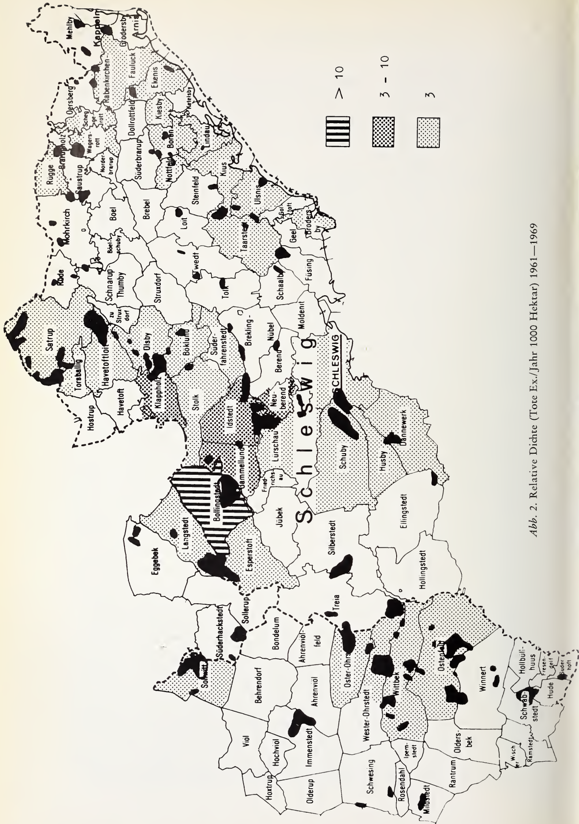
Abb. 2. Relative Dichte (Tote Ex./Jahr 1000 Hektar) 1961—1969