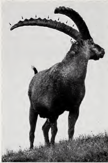
Abb. 2. Ca. 9 1 / 2 jähriger Bock ( C. i. ibex ) aus dem Safiental, aufgenommen im Sommer 1969. Die Knoten liegen zwischen den Jahrringgrenzen und fehlen im basalen, zuletzt geschobenen Teil des Hornes ganz

Ibex hörnern die Knoten direkt an der Hornbasis gebildet und fertig ausgeformt aus der Stirnhaut geschoben (vgl. HEDIGER 1951).