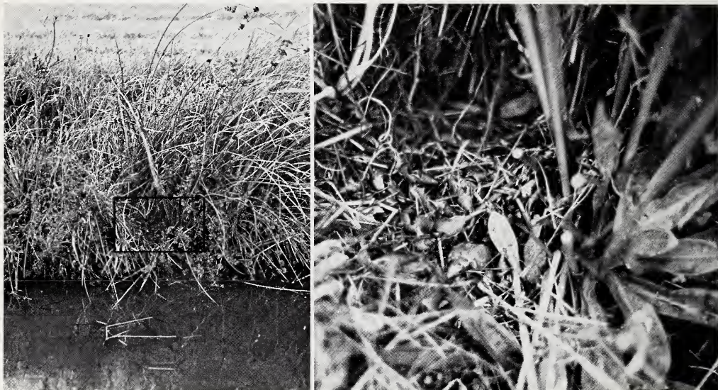
Abb. 1. a (links). Sammelplatz mit Gehäusen von Lymnaea stagnalis in der Uferböschung eines Fischteiches. b. (rechts). Detailansicht (Uferbewuchs teilweise entfernt)

Eingehender untersuchten wir 60 solcher Sammelplätze. Die Anzahl der pro Sammelplatz gefundenen Schalen lag zwischen 4 und 400, die Gesamtzahl aller am Ufer von 5 ha Weiherfläche gefundenen Schalen betrug ca. 4000.