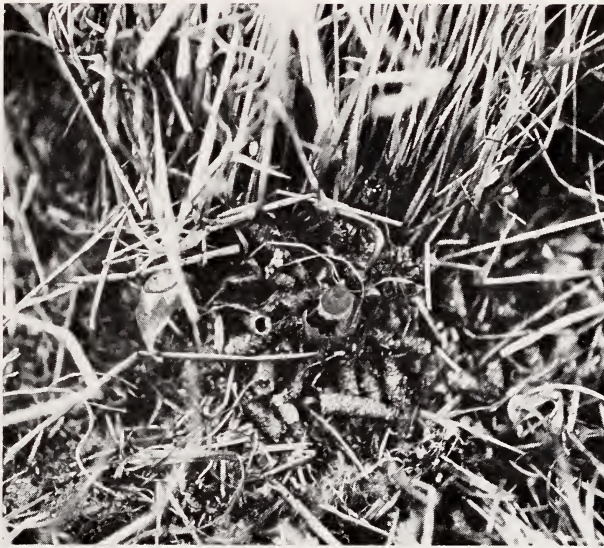
Abb. 4. Sammelplatz mit leeren Trichopterenköchern und zwei Gehäusen von Lymnaea stagnalis

In den Monaten März und April fanden wir an 7 der untersuchten Fischteiche zahlreiche Ansammlungen leerer Köcher von Trichopterenlarven (Abb. 4). Sie befanden sich wie die übrigen Sammelplätze am Gewässerrand unter Pflanzen versteckt. Auf einzelnen Plätzen lagen bis zu 200 Köcher, insgesamt wurden etwa 1500 Exemplare gefunden. Wie bei den Gastropodenfunden stellen auch hier mittelgroße Exemplare die Hauptmasse dar.