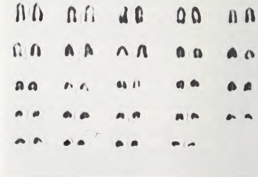
Abb. 1. Karyogramm eines ♀ von Apodemus sylvaticus aus Nepal. Geschlechtschromosomen nicht hervorgehoben

Apodemus gurkha (Abb. 2): 2n = 48 . Mindestens 2 kleine Paare sind metazentrisch, 1 oder 2 weitere ebenfalls meta- oder submetazentrisch. Die 5 längsten Paare sind subtelozentrisch. Bei dem isolierten, nicht submetozentrischen, langen Element dürfte es sich um das X-Chromosom handeln. Unklar ist die Natur des Y-Chromosoms. Ferner könnten noch weitere nicht völlig akrozentrische Elemente vorhanden sein.