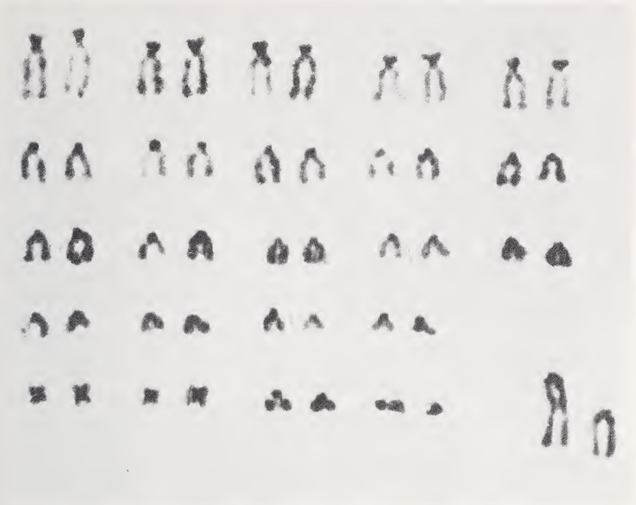
Abb. 2. Karyogramm eines ♂ von Apodemus gurkha aus Nepal. Die Identifikation der Geschlechtschromosomen (rechts unten) ist unsicher