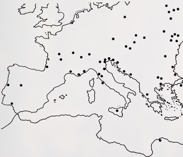
Die Verbreitung des Riesenabendseglers ( Nyctalus lasiopterus ) in Europa und Afrika (Quellen s. Literaturverzeichnis)

Die näheren Funddaten der 3 libyschen Exemplare sind: 9. 8. 1981 Wadi Kuf (32°42'N/21°34'E) ♂ aus Deckenkolk einer Halbhöhle; 19. 8. 1981 (Cyrene 32°47'N/21°49'E) 2 ♂ bei abendlichem Netzfang vor Apollobrunnen. Die beiden Fundorte liegen im Jebel Akhdar, einem bis zu 800 m aufragenden karstigen Küstenplateau. Es weist besonders im