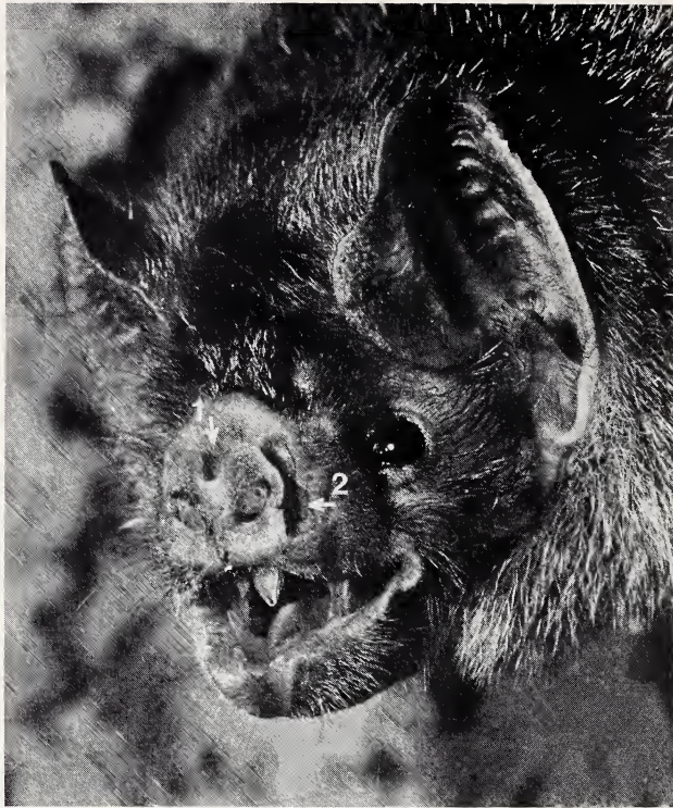
Abb. 1. Kopf einer Vampirfledermaus ( Desmodus rotundus ). Die Pfeile weisen auf die Nasengruben (1 = apikale Grube; 2 = linke laterale Grube)