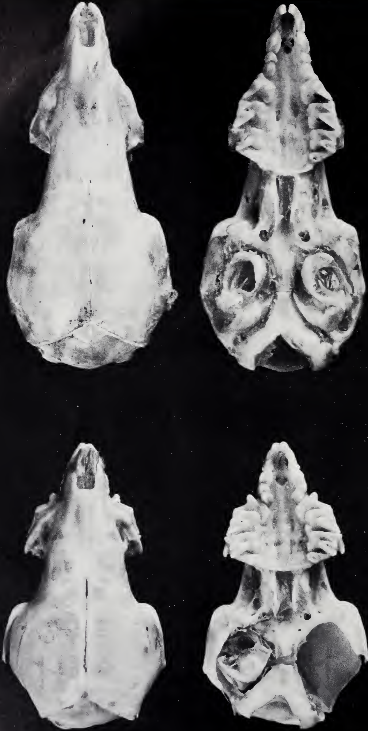
Abb. 1. Mopsschädel von Crocidura russula im Vergleich zu einem normalen Schädel der Art. Links: Juveniles Exemplar aus Chêne-Bougeries, Canton de Genève (Muséum Genève, MHNG 1287.67); rechts: Juveniles Exemplar aus Interlaken, Kanton Bern (Museum Bonn, ZFMK 39.131b).