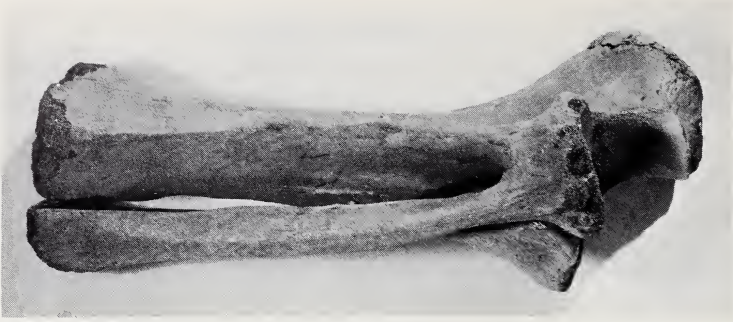
Abb. 4. Radius-Ulna dex. von M. cf. primigenius (Ansicht von vorn; ca. \frac{1}{7} nat. Größe). Fundort, Sammlung und Foto wie Abb. 3

Bei der Nr. GW 179 (Radius-Ulna sin.) fehlt die distale Epiphyse. Der rechte Teil der proximalen Gelenkfläche des Radius ist mit der lateralen Fläche der Ulna verwachsen. Entlang den Diaphysen reicht die Verwachsung bis 10 cm in distaler Richtung. Eine Aussage über die eventuelle Verwachsung der distalen Epiphysen ist durch Beschädigung unmöglich geworden.