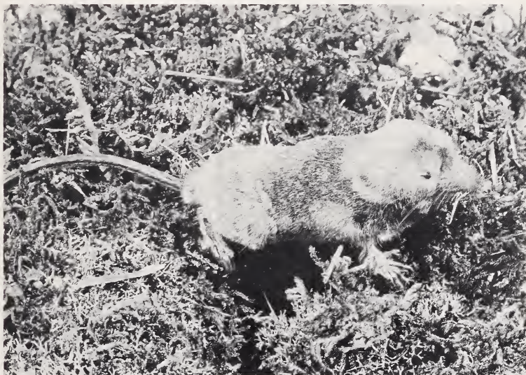
Fig. 2. Neomys fodiens (Pennant, 1771) atteinte d'albinisme. L'animal, une femelle adulte, était lors de sa capture de couleur blanc sale, seule subsistait la zone foncée située sur la ceinture scapulaire et sur la tête (cliché J. LECOMTE, C.N.R.S., d'après animal mort)

On connaît de nombreux cas européens de mélanisme total ou partiel pour le genre Neomys ( N. fodiens , N. anomalus ): Allemagne (JACOBI 1928; KAHMANN et ROSSNER 1956; SCHÖBER 1959); Autriche (BAUER 1960); Finlande (SKAREN 1973); Grande-Bretagne (CROWCROFT 1957); Pays-Bas (HUSSON 1947; VAN LAAR et VAN LAAR 1966); France (GIBAN 1956; SAINT GIRONS 1963) entre autre. En revanche, les individus présentant un albinisme total ou partiel sont inconnus à notre connaissance. Les spécimens montrant une bordure de l'oreille ou une extrémité de la queue blanche (CORBET 1963; SAINT GIRONS 1963), caractère qui peut-être commun chez certaines populations, ne sont pas à considérer comme individus affectés d'albinisme. De plus, nous savons que la présence des petites taches blanches dans la région du cou ne présente pas un cas d'albinisme partiel. Ces taches, toujours localisées sur des femelles adultes, résultent des morsures du mâle pendant la copulation (CROWCROFT 1957). Notons toutefois que ces taches n'apparaissent pas dans