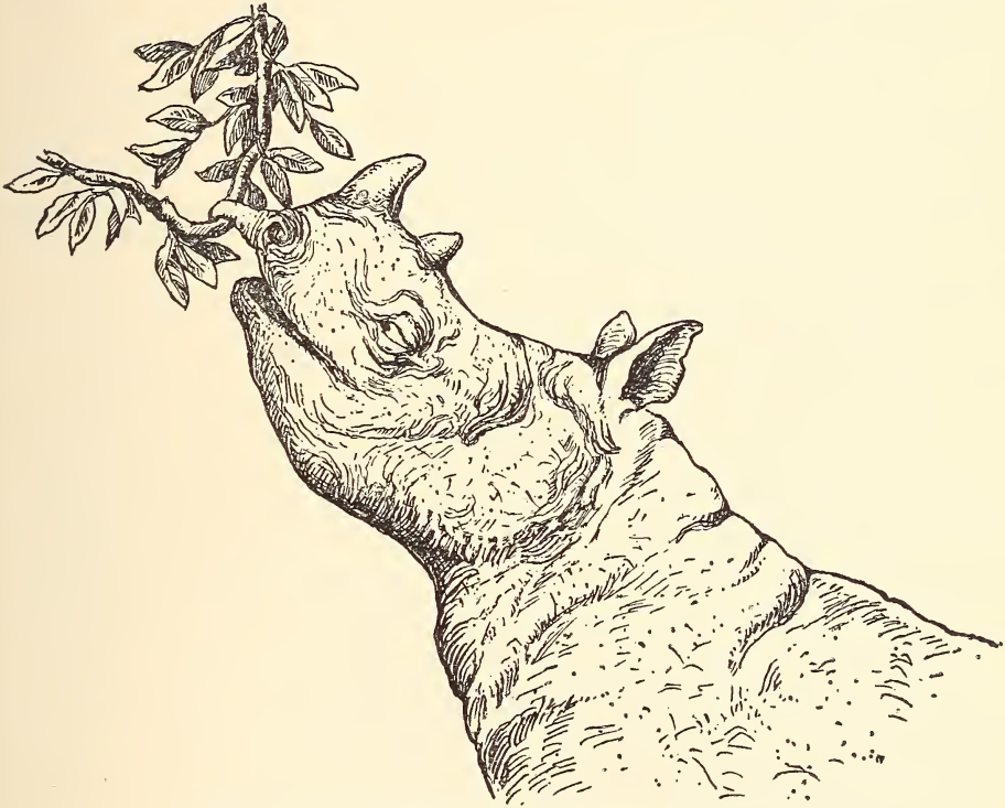
Abb. 4. Diceros bicornis L. beim Äsen von Blättern.

sich nämlich zwei verschiedene biologische Typen, die ihre Ernährungs- und Aufenthaltsweise morphologisch in der Form der Oberlippe dokumentieren. Der zweigfressende Typ besitzt eine rüsselförmig zugespitzte Oberlippe, welche Zweige erfaßt und abknickt (Abb. 3 links und Abb. 4). Ihm steht der Grasfressertyp gegenüber, der mit stumpfer gerundeter Oberlippe das Gras abschert (Abb. 3 rechts). Die Verschiedenheit ist so ausgesprochen, und der Grad des funktionellen Ersatzes von Oberzähnen durch Hornlippen so schwer richtig einzuschätzen, daß man auch die eventuelle Rückwirkung auf das Gebiß nicht unterschätzen darf zugunsten einseitiger Betrachtung der uns hier speziell interessierenden Korre-