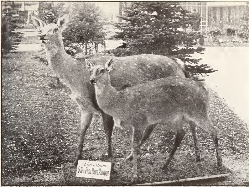
Abb. 7. Zu O. WETTSTEIN, Zwei Rot-Sikawild-Bastarde.