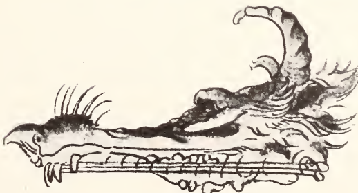
Abb. 6. Zu I. KRUMBIEGEL, Das sog. Kompensationsgesetz Goethes.