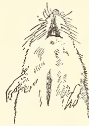
Abb. 3. Waldmaus mit schmalen Längsstreifen an der Halsunterseite.

Das für die Art besonders kennzeichnende Halsband variiert auch bei den Stücken von unserer Insel nach Farbe, Farbintensität und Form erheblich. In den Abbildungen 1 und 2 sind zwei extreme Halsbandformen der Usedomer Tiere abgebildet. Abb. 1 bezieht sich auf Nr. 4, Abb. 2 auf Nr. 12 der Tabelle. Zum Vergleich ist in Abb. 3 ein am 8. 1. 24 im Swinemünder Kurpark gefangenes Stück von A. sylvaticus L. wiedergegeben, das an der Halsunterseite einen schmalen gelben Längsstreifen trug.