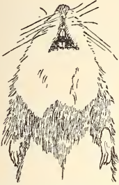
Abb. 1. Gelbhalsmaus mit breitem Band an der Halsunterseite.

Schwanz wie 100:95,52; bei den Usedomer Gelbhalsmäusen wie 100:97,28; das bedeutet eine Abnahme der prozentualen Schwanzlänge von Pommern nach Estland um 1,76%. Auch die Ohrlängen verhalten sich gleichsinnig: trotz ihres größeren Körpers haben die Estländer Tiere — von 35 sind Ohrlängen angegeben — nur eine durchschnittliche Ohrlänge von 16,97 mm, die Usedomer (15 Stück) eine solche von 18,07 mm.