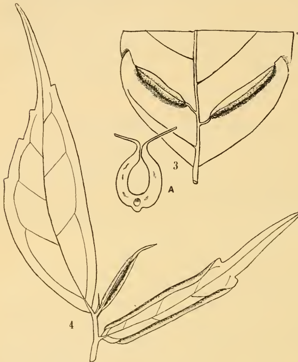
Fig. 3. Galle auf Conocephalus suaveolens , bei A die an beiden Seiten Querschnitt derselben, Nat. Grösse.

Von den drei durch Thripse gebildeten Gallen, die wir, ausserhalb der schon im vorigen Beitrage beschriebenen, noch aufgefunden haben,