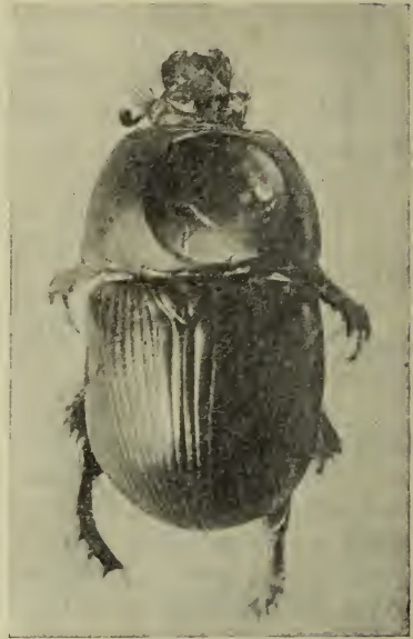
2 × nat. Größe.